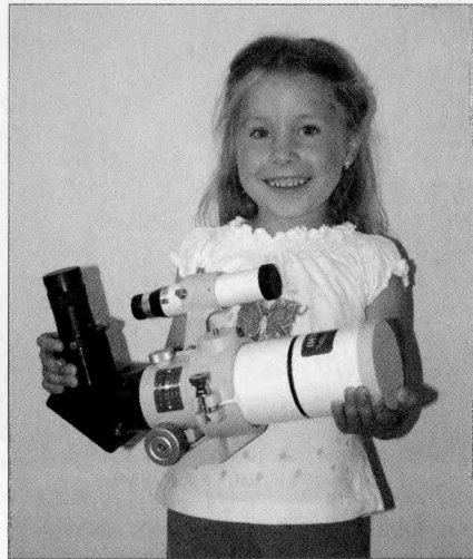
A Takahashi kis távcsőve játékszernek tűnhet, használatában azonban egyáltalán nem gyerekekjáték

Végül 60/355-ös Takahashi FS 60 C mellett döntöttem, erről írok a továbbiakban egy kis ismertetést. Azt szeretném bemutatni, hogy egy igazán kicsi távcső is lehet jó választás, illetve hogy milyen apróbb kellemetlenségek bosszanthatják az embert még egy „neves” távcső esetén is.