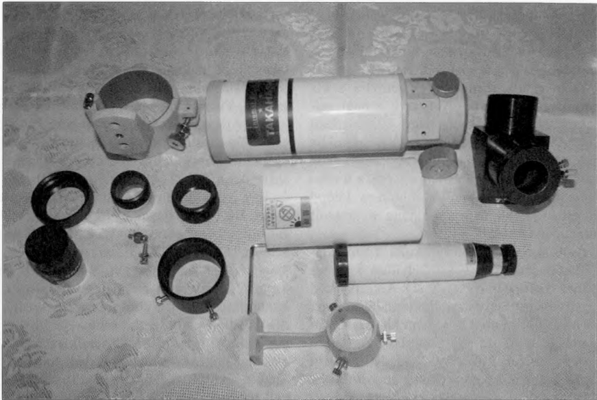
A kis apo (majdnem) darabjaira szedve. A látszat ellenére nem könnyű rájönni, melyik közgyűrű mire való

körül teljesítene, míg a TeleVue 85-ös táján lenne. Fókuszban persze nem látszik a színi hiba. Mindenféle reduktort lehet kapni a távcsőhöz, amelyekkel ez a maradék színi hiba is eltüntethető, de a gyakorlatban nincs jelentősége a dolognak. Esetleg fényképezésnél jöhet jól.