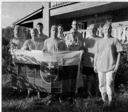
Expedíciónk csoportképe.

Másnap megnéztük a várost. Mindenhol fegyelem, mi voltunk a leghangosabb társaság, nem láttunk megrogált emlékműveket, emléktáblákat, mindenütt tisztaság. A főtéren Lenin-szobor – Oroszországban Lenint ma is nagy tisztelet övezi. Az áruházakban hasonló a választék, mint hazánkban, hiszen Kína nincs olyan messze... A város nincs felkészülve a turizmusra, ugyanis az összes matrjoskát meg orosz tojást felvásároltuk, képeslapot viszont nem lehetett kapni Gorno-Altajszkról. Az élelmiszerek között főleg a sajt és a hal dominál. Persze lehet kapni még ott a világ végén is Zlatý Bažant sört – igaz, csak két üveggel, de nekünk ez is elég volt.