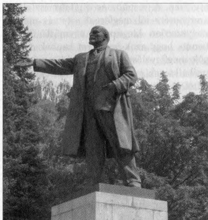
Számunkra már szokatlan a látvány: Lenin-szobor Gorno-Altajszkban

A következő napokban megnéztük a hősöknek állított nagy emlékművet. Bejártuk a város elfelejtett kis utcáskáit. Szinte kihaltak volt minden, sok faház kék ablakkerettel, poros és kavicsos utakkal. Meglepő volt számomra, mikor egy lerobbantnak kinéző házból tiszta és takaros emberek jöttek ki. Mivel nem tudtuk az egyik dombot megmászni, célba vettük a másikat – sikerrel. Szép kilátásunk nyílt a városra, ahogy a völgyben meghúzódik élénkzöld dombokkal övezve.