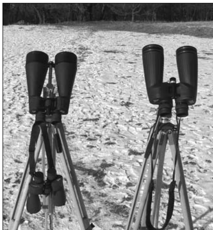
A 20x80-as (balra) és a 10,5x70-es az ágasvári észlelőórén

A 8x56-os Titanium könnyű kis binokli, jó, hogy kicsi a nagyítása. Nagyobb látszó méretű nyílthalmazok fürkészésére alkalmas leginkább. Az M67-et kissé grízesnek láttam, ami a bontás kezdeti jeleire utal. Gyönyörű volt vele az M35 a Geminiben, az M36–37–38 az Aurigában. A nagyobb kiterjedésű, természetesen többnyire eléggé laza szerkezetű csillagcsoportok közül valamiért az \alpha Persei Mozgó Halmaz tetszett leginkább.