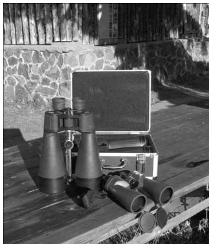
A binokulárok az ágasvári észlelőasztalon