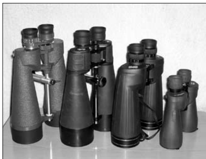
A cikkben szereplő binokulárok: Vixen 20x80, TS 20x80 LE, 10,5x70 Waterproof és 8x56 Titanium

A változóészlelések során nagyjából 9–9,3 magnitúdóig lehetett Kecskemétről használni. De egy binokulár használati értékét a sokoldalúság csak javítja. Ez elmondható a 8x56-osról, hiszen ezzel egyaránt el lehet érni a teszteléskor épp fényes R Scutit (5,1–5,2 m ), de az S Draconist is ( 9,0–9,1 m ). Ugyancsak meglepő volt a közvilágítás kimaradása július 5-én. Az éjféli körüli órákban még csak a Sagittarius néhány mélyég-objektuma (M8, M17, M20) volt könnyen felismerhető a kis binokulárral, míg később már az M33 Tri GX is „csak úgy”, könnyen beúszott a látómezőbe.