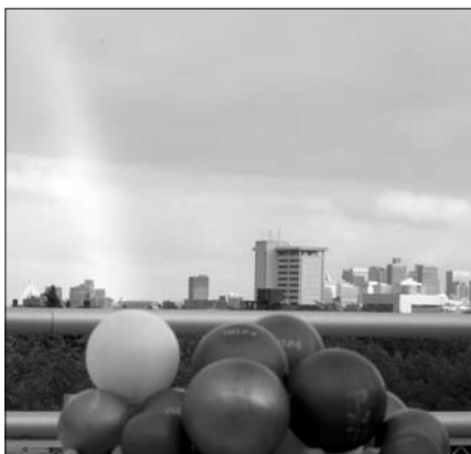
Exobolygós üdvözlét Bostonból: a HatNet program bolygói 2008 végén. A Bakos Gáspár által vezetett HATNet, azaz Hungarian Automated Telescope Network (Magyar Automatikus Távcsohálózat) hat darab 11 cm átmérőjű távcsohól álló hálózat, mellyel eddig 13, fedési jelenséget mutató exobolygót fedeztek fel

hoz viszonyítva megtartani az előadóval szemben húzódo 5 méter hosszú falon. A bolygók Naphoz viszonyított mérete természetesen méretarányos maradt.