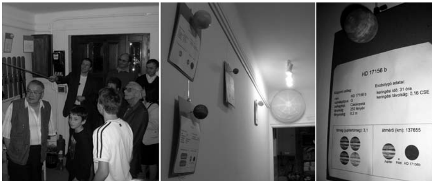
Exobolygó-modellek a Polaris előterében: a Naprendszer tagjai a falon (balra), a Nap a háttérben és előtte három exobolygó a falon (középen), és a HD 17156b jelű planéta modellje és paraméterei (jobbra)