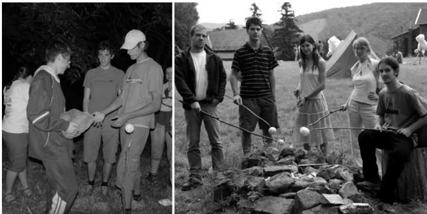
Balra: az XO-3b jelű exobolygónak a Jupiternél 1,2-szer nagyobb méretének (fehér gömb), és 11,8 jupitertömegének (szikla) szemléltetése. Jobbra: szalonnasütés exobolygó módra. A nyársak végén frissen készült forró Jupiter-modellek láthatók

Az exobolygók közül a modellben az alábbiakat tüntettük fel: HD 149026b, HD 209458b, TrES-3, HD 17156b, XO-3b, amelyek átmérője a Jupiterének 0,72 és 1,4-szerese, tömege pedig 0,36 és 11,8-szerese között volt. Mind forró Jupiter típusú égitest, amelyek a valóságban 0,02 és 0,16 CSE távolság között keringnek központi csillaguktól. Egyetlen