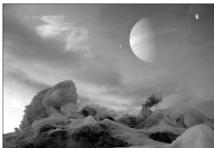
A nappali égbolt egy exobolygó hipotetikus holdjának felszínéről (D. Durda)

Két dolgot még mindenképp fontos megemlíteni. Az egyik, hogy együttműködésre törekszünk az Intézet egyéb munkacsoportjaival és az ország többi csillagászati kutatóközpontjával – utóbbi a Szegedi Tudományegyetem, a Bajai Csillagvizsgáló és az ELTE Gothard Asztrofizikai Observatórium kutatóival elkezdett közös munkák formájában kezd kialakulni, s felvettük a kapcsolatot az ELTE égi mechanikával foglalkozó szakembereivel is. A másik, hogy a Lendület-program iránt mutatott felfokozott médiaérdeklődésnek köszönhetően rendszeresen szereplünk az írott és elektronikus sajtóban, ami lehetőséget teremt a csillagászati ismeretek eddigieknél is szélesebb körű terjesztésére. Talán az itt felsorolt tényezők is jelzik, hogy szeretnénk, ha az MTA-tól kapott lehetőség – egy kis szójátékkal élve – a magyar csillagászat egészének lendületet adna.