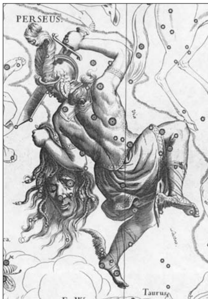
A Perseus csillagkép Helvelius Uranographiájában

Az Ikerhalmaz NGC 869 jelű tagja mellett két érdekes kettőscsillag található, mindkettő Otto Struve első kiegészítő katalógusában szerepel. Az első az STTA 25, amely amelllett, hogy kettőscsillag, egyéb izgalmat is tartogat, hiszen a főkomponens egy pulzáló változó, a V551 Persei. Igen csekély mértékben változik fényessége, mindössze 0,03 magnitúdót, periódusideje 5,6 nap. Rendkívül könnyen felbontható binokulárkettős, még a tagok is viszonylag hasonló fényességűek, csak 1 magnitúdó az eltérés a két csillag között. Az STTA 25 mellett igen közel találjuk az STTA 24 többes rendszerét. Az előzőleg említett pároshoz hasonlóan ennek is igen könnyen meg tudjuk figyelni a két fő csillagát, már akár egy kis binokulárral is. A probléma a rendszer C tagjával van, mivel közel 13 magnitúdó a fényessége, így kisebb távcsövekkel, illetve városi környezetből igen nehéz a megpillantása. Az STTA 24 igen nagy sajátmozgású rendszer, a katalógusada-