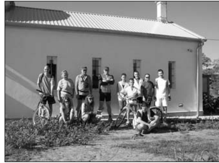
Kerékpárosok a süllysápi csillagvizsgálónál

Az Uránusz Gombán, a nemesi kúriák falujában található. A Szaturnusznak az ezer éves Tápiószecső adott helyet, a Jupiter Úriban van.