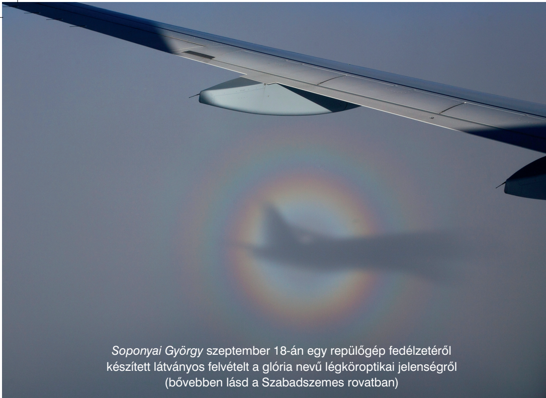
Soponyai György szeptember 18-án egy repülőgép fedélzetéről készített látványos felvételt a glória nevű légkóroptikai jelenségről (bővebben lásd a Szabadszemes rovatban)