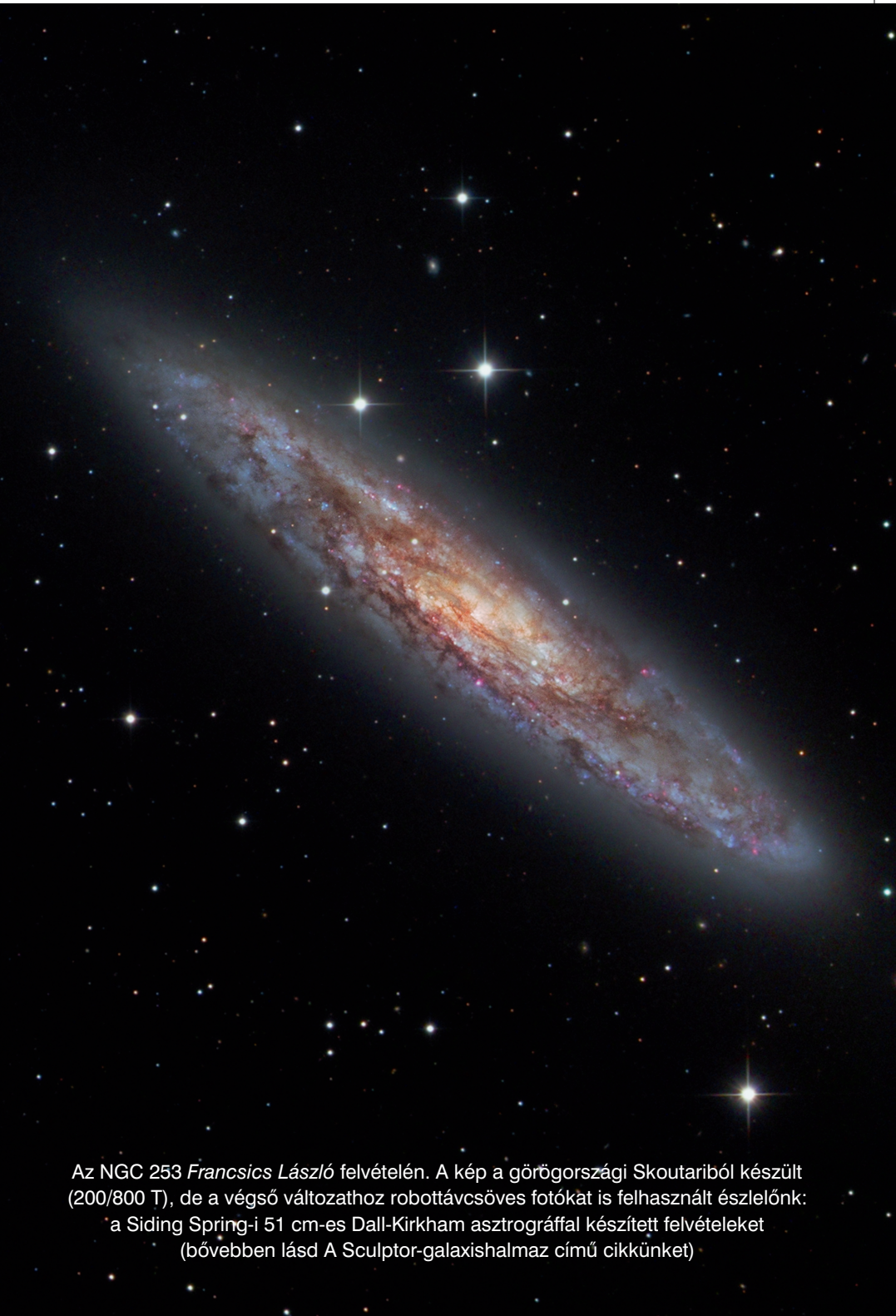
Az NGC 253 Francsics László felvételén. A kép a görögországi Skoutariból készült (200/800 T), de a végső változathoz robotávcsöves fotókat is felhasznált észlelőnk: a Siding Spring-i 51 cm-es Dall-Kirkham asztrógráffal készített felvételeket (bővebben lásd A Sculptor-galaxishalmaz című cikkünket)