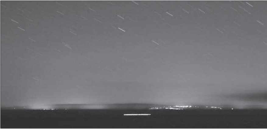
Olaszország parti fényei Lastovóról fényképezve

messzebbre a szárazföldről. A helyi fények minimálisak, ráadásul az elmúlt években a teljes közvilágítást felújították, csak teljesen ernaózott lámpatestek vannak (azaz nem világítanak közvetlenül az égbolt irányába). Az égbolt látványa nagyon jól megközelíti a természetest, különösen a zenit környékén. Azonban egy ilyen helyen meglepő dolgokat is lát az ember. A horizont közelében jól láthatók a legerősebb mesterséges fénylések: Split (90 km távolságból) és Korčula (32 km-ről). De ezekkel összemérhető Dubrovnik (100 km) és Bari (180 km) fénykupolája. Bizony-bizony ez utóbbi már az olasz csizmáról világít át! Szinte az egész olasz partvidék érezhető az égbolt fényében – nemhiába, ha fényszennyezésről van szó, a 200 km-es távolság sem sok. Magam is meglepődtem, hogy az alapoptikaként használt 18–50 mm-es zoom lencse leghosszabb állásában készült éjszakai képen kirajzolódik az olasz partvidék fölötti hegyvidék az egyedi lámpákkal együtt. Szinte érezni a Föld gömbölyűségét is, ahogy kitakarja a tenger a mélyebben fekvő részeket, de a fények onnan is eljutnak a hegytetőkig. Dubrovnik irányában időnként jelentős felfényléseket láthattunk. Az ok egyszerű: a tengerparton kanyarodó út egy helyen pont olyan érintőjű, hogy a reflektorral haladó autók egy pillanatra pont Lastovo irányába világítanak.