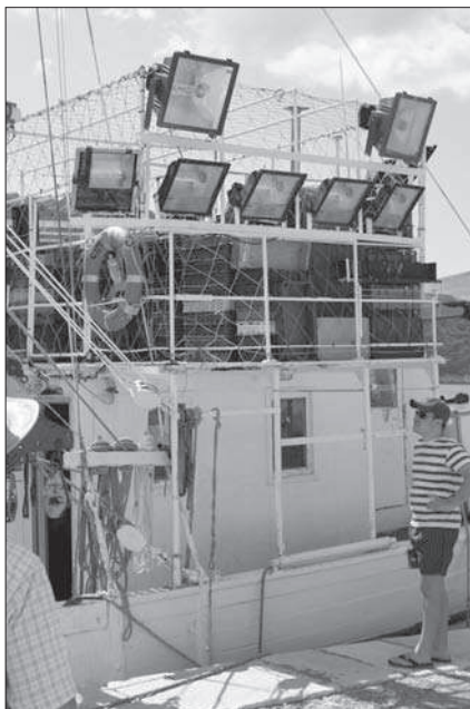
Lastovo sötét égboltjának első számú ellenszélnek számítanak a halászhajók fényvetői

Az első utunk alkalmával, 2010-ben az időjárás nem volt optimális: nem mutatta meg az éjszakai égbolt az igazi arcát. Most nagyobb szerencsém volt, gyakorlatilag egy hétig kiváló derült éjszakákban volt részünk.