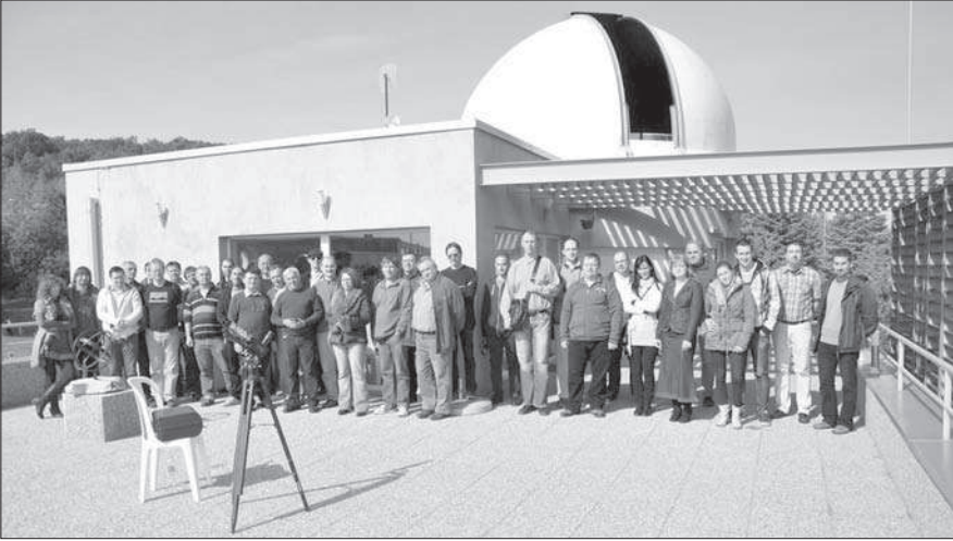
A találkozó csoportképe a csillagvizsgáló teraszán

vonalat tartalmazó „sima” nóvákhöz hasonlóan – a robbanás egy előzőleg ledobott anyagfelhőbe történik, ütközve a cirkumstelláris gázzal. Emellett nagy érdeklődéssel hallhattunk beszámolót a legnagyobb luminozitású csillagok (LBV-k) szuper-kitöréseiről, az ún. „szupernóva imposztorokról” is. „Új” altípusról lévén szó, előadónknak meglepően nagyszámú, közelmúltban készült felvételt sikerült felvonultatnia ezekről a különleges objektumokról, amelyeknél a viszonylag csekély, a „normál” szupernóváknál egy nagyságrenddel kisebb robbanási sebesség eredményez keskeny spektrumvonalakat. (Várhatóan az \eta Carinae is szupernóva imposztorként végzi valamikor a következő 10 000 év során.)