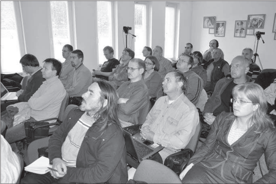
A hallgatóság a Balaton Csillagvizsgáló előadótermében

követően szinte azonnal észlelhetővé váltak a csillagok kitérései, többnyire még felszálló águkban!)