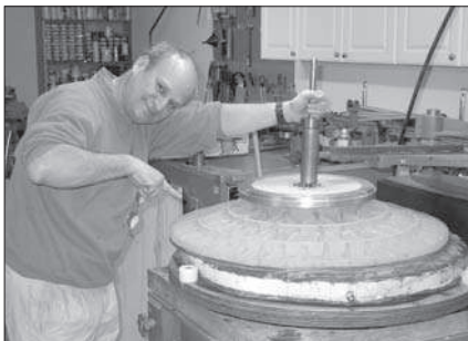
Készül a 81 cm-es óriástükör. Figyeljük meg a tűkör könnyített szerkezetét, valamint az eredetileg is a görbülethez illeszkedő hátoldalt

teljesen megegyező nehézségekkel küzdenek), küzd a fényszennyezés visszaszorítása ellen (a budapestiek körében hírhedt Bálna történetének hallatán csak a fejét fogta), ő is megmaradt amatőrnek.