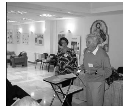
Arnold Zenkert előadást tart a 2002-es kőszegi nemzetközi napórás találkozón

Arnót szoros kapcsolatok fűzték Magyarországhoz. Az 1980-as évektől rendszeresen megjelent a csillagászati (és „napórás”) találkozókön, többször tartott előadást (legutolsó látogatásakor, 2002-ben a kőszegi Nemzetközi Napórás-találkozón a házfalak azimut szögének egyszerű meghatározásáról). De szívesen töltötte szabadságát is Magyarországon. Széles körű ismertsége révén gyakran teremtett kapcsolatot a hazai napóra kutatók és külföldi kollégáik között. Sokszor szervezte meg annak lehetőségét, hogy a magyarországi napórások részt vehessenek külföldi konferenciákon. Felfigyelt a külföldön fellelhető magyar vonatkozásokra, pl. ő bukkant rá a bützowi katedrális XVIII. sz.-i napórájának feliratai közt Maximilian Hell nevére. (Ez azért is érdekes adat, mert Hell sohasem járt az észak-németországi Bützowban.)