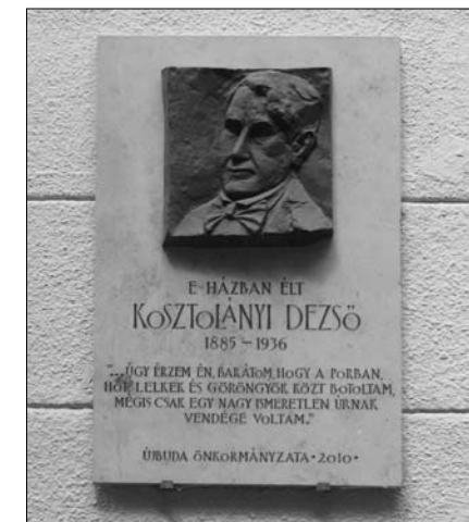
Emléktábla a Bartók Béla út 15. sz. ház falán