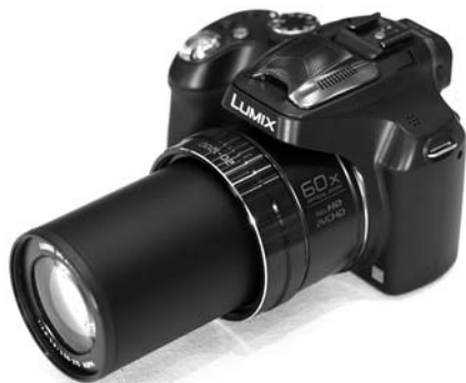
Panasonic Lumix DMC-FZ72 (az USA területén FZ70)

Természetesen más paramétereket is figyelembe vettem a választásnál, így talán nem untatok senkit, ha megemlítem, hogy az objektívben optikai képstabilizátor van, ami látványosan csökkenti a kéz mozgásának hatását maximális nagyításon is. Mivel az objektív nem cserélhető, ezért a gépbe nem megy por. A fényerő sajnos változó, de akár a 2,8-as értéket is eléri a nagy objektívátmérő miatt. A FullHD videót zoomhoz igazodó sztereo hanggal veszi fel, de az automatikus panorámakép összerakó módot is nagyon praktikusnak találom. Természetesen manuális üzemmódban is üzemel a gép, és RAW felvételt is készít.