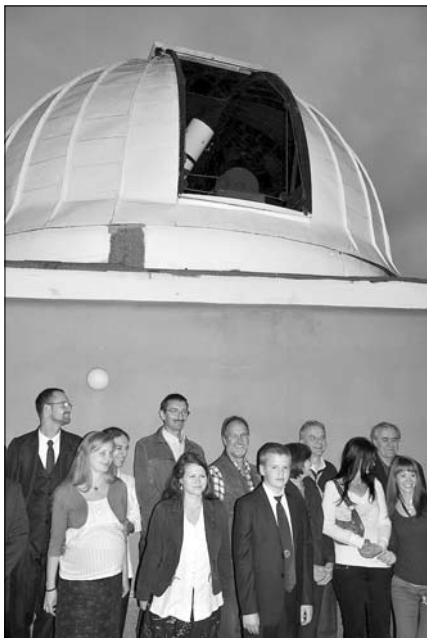
A résztvevők a kupola előtt (balra) és az emléktábla alatt elhelyezett koszorúk (jobbra).