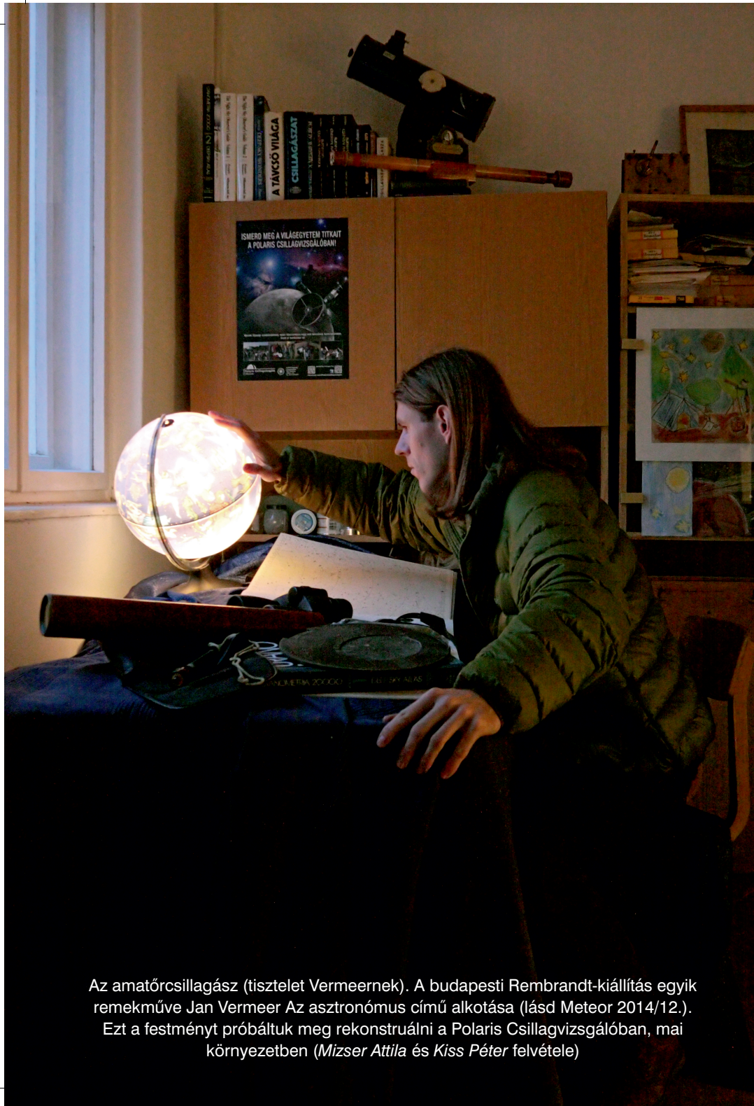
Az amatőrcsillagász (tisztelet Vermeernek). A budapesti Rembrandt-kiállítás egyik remekműve Jan Vermeer Az asztronómus című alkotása (lásd Meteor 2014/12.). Ezt a festményt próbáltuk meg rekonstruálni a Polaris Csillagvizsgálóban, mai környezetben