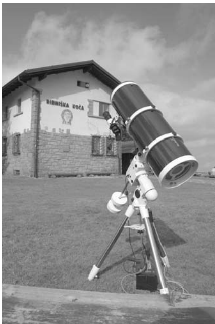
Kitelepülésen 250/1000-es Newtonnal a szlovén Alpokban, 2011 szeptemberében

betanítást, mindhárom csillagot pontosan a szállkeresztes okulár látómezejének közepébe állítom. Addigra a távcső már legalább egy órája a szabad levegőn hűlt, ennek ellenére általában még észrevehető a tükör feletti turbulens határréteg okozta képromlás. A pontos, háromcsillagos betanítás azért szükséges, hogy a pólus-pontosítás elvégezhető legyen, illetve ha az éjszaka folyamán a távcsövet át kell fordítani, akkor minél pontosabban újra ráálljon az objektumra. A sikeres betanítás után, ha van még időm a sötétség teljes beálltáig, vagy a tükör még nem hűlt le, akkor elvégzem a pólus-pontosítást (Polar re-alignment), majd az újabb háromcsillagos betanítást. Ezt akkor is megteszem, ha a távcső több napig felállítva marad.