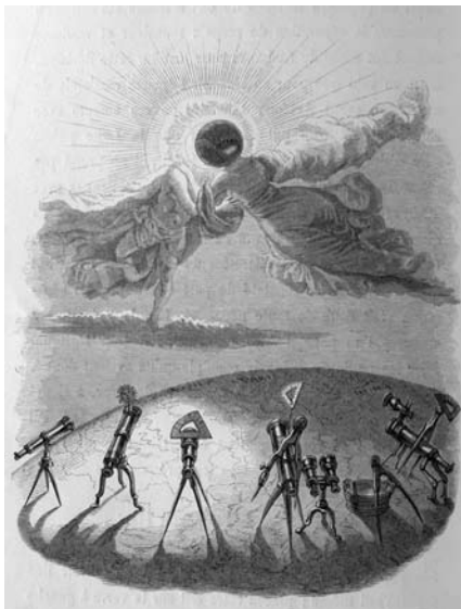
Gérard Grandville 1844-ben született karikatúrája a napfogyatkozásról és szemléltőről

Amikor a Hold a Nap elé kúszva csókot ad csillagunknak, különleges élmény. Ez az élmény mindig is – néha komoly – szerepet játszott az emberiség történetében és hát létezik egy számomra kedves alkotás, Gérard Grandville francia karikaturista egyik műve egy ilyen eseményről, amely nagyon érzelmesen mutatja az aktust (A Nap átöleli a Holdat, Un Autre Monde, 1844).