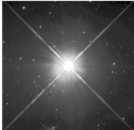
A Proxima Centauri a Hubble-űrtávcső felvételén