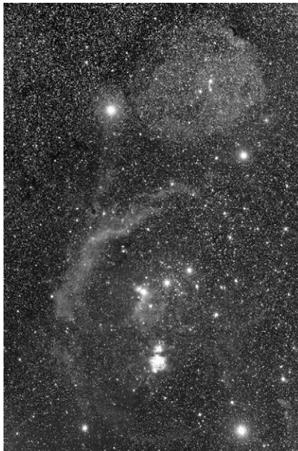
A Barnard-4 és az Orion csillagkép. 2014. december 23-án készült Canon EF 50 mm-es objektívvel, 86x180 s expozícióval, ISO 800 érzékenység mellett

refraktor működött. Ugyanolyan szorgalmasan dolgozott, mint előző munkahelyén, és minden érdekelte az éjszakai égen, ami világít, meg ami sötét. Hale ráadásul hetente nem egy, hanem két éjszakát biztosított Barnardnak, hogy az akkori idők legnagyobb távcsövével észleljen. Magánadományból 1904-re sikerült egy kifejezetten fotografikus észlelésre alkalmas távcsövet is beszerezni a Yerkes Obszervatóriumba: a 10 hüvelyk átmérőjű Bruce-távcsövet. De a wisconsini helyszín nem volt igazán kedvező csillagászati megfigyelésekhez.