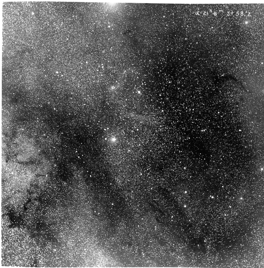
A Tejút egy részlete a Cepheus csillagképben Barnard felvételén

Legutolsó, 1892-ben felfedezett üstökösét már egy fotólemezen megörökítve találta, első ízben a csillagászat történetében. A felfedezésekért járó jutalomból még házat is tudott vásárolni, de friss házasként csak 1883-ig lakott abban feleségével, mert akkor a Vanderbilt Egyetem tanulmányi ösztöndíjat ajánlott Barnardnak.