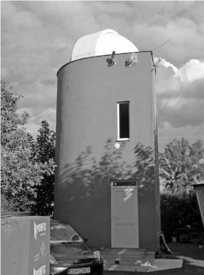
Egy álom megvalósult: a sárréti csillagvizsgáló tornya a június 18-i találkozón