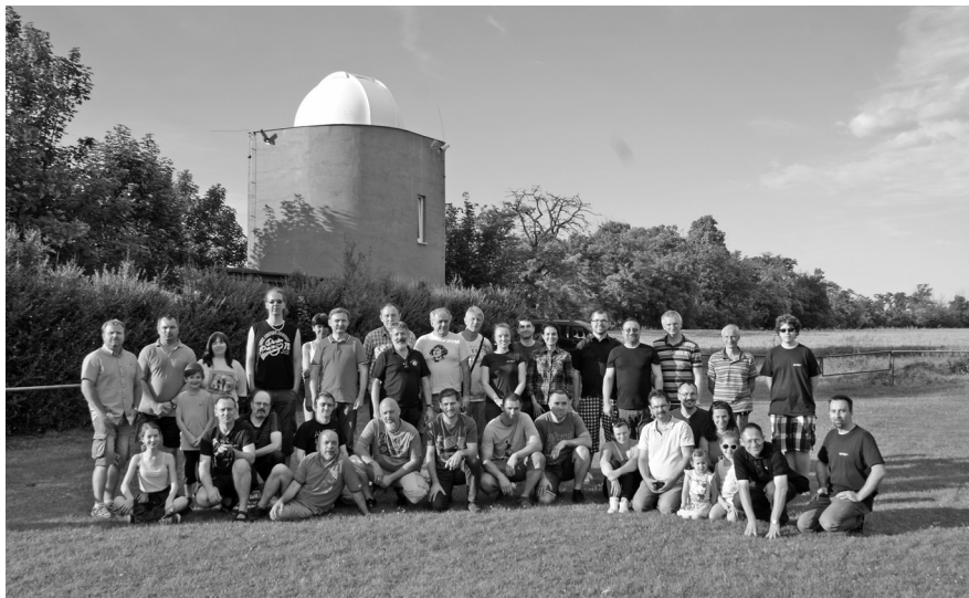
A találkozó résztvevői a sárréti kupola előtt