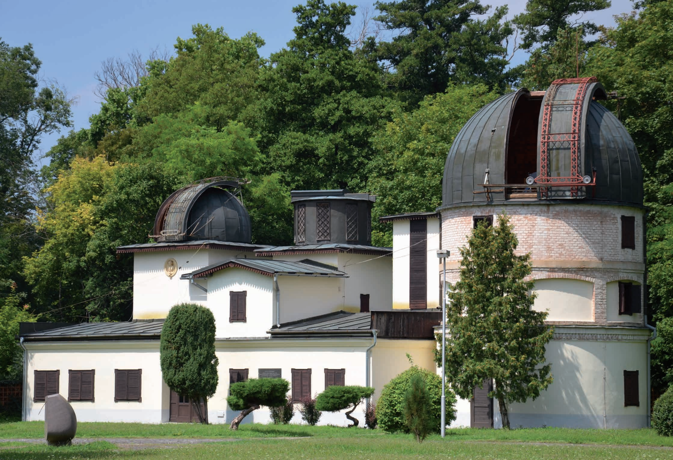
Az ógyallai Konkoly-csillagvizsgáló