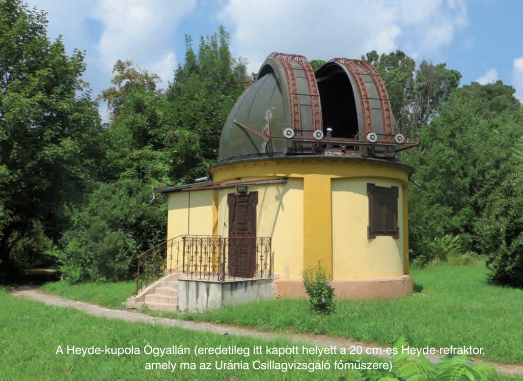
A Heyde-kupola Ógyallán (eredetileg itt kapott helyett a 20 cm-es Heyde-refraktor, amely ma az Uránia Csillagvizsgáló főműszere)