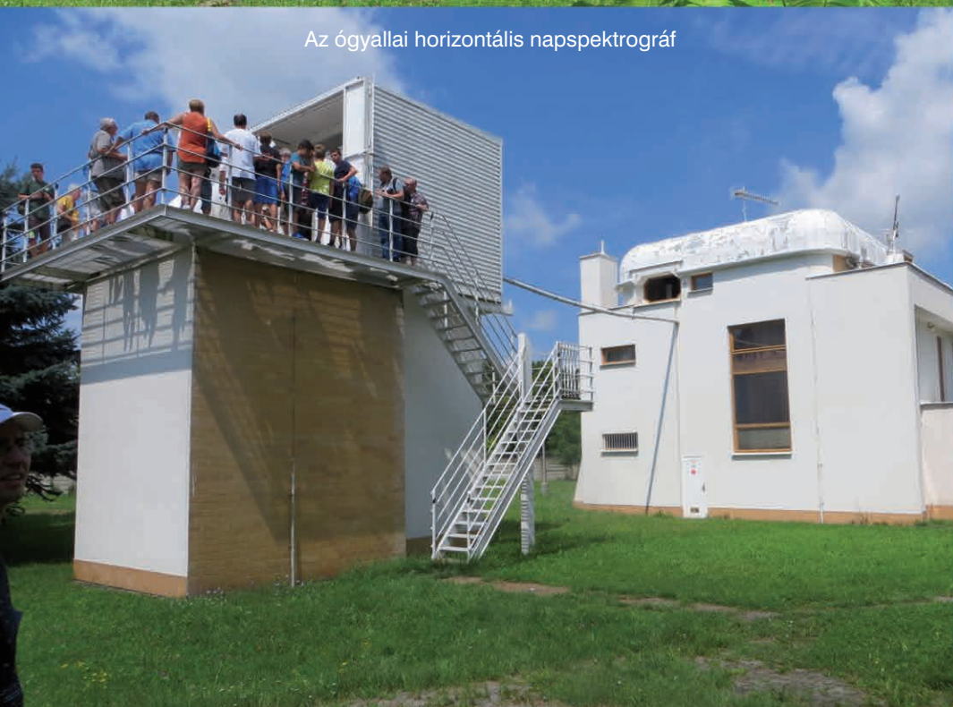
Az ógyallai horizontális napspektrográf