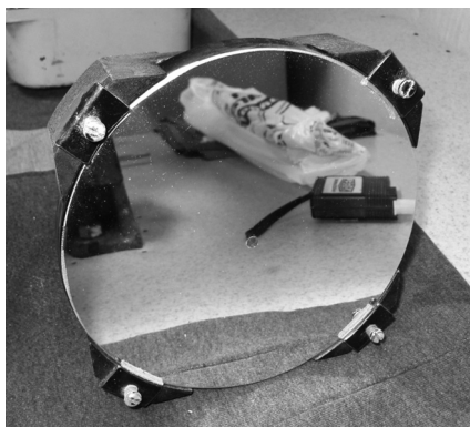
A 160 mm-es főtükör

A fókuszírózó Crayford rendszerű, egyedi gyártású, (hajlított acéllemez, cső, golyóscsapágy, műanyag persely, acéltengely, fém forgatógomb konstrukciójú).