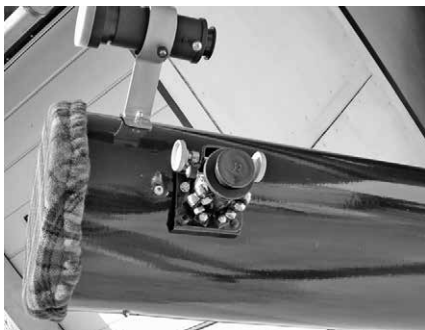
A fókuszírozó és a keresőtávcső

A Dobson rendszerű állvány 20 mm-es pozdorja lapokból kivágott elemekből készült, egyedi kivágásokkal a kisebb súly, de még elegendő merevség biztosítása mellett. A