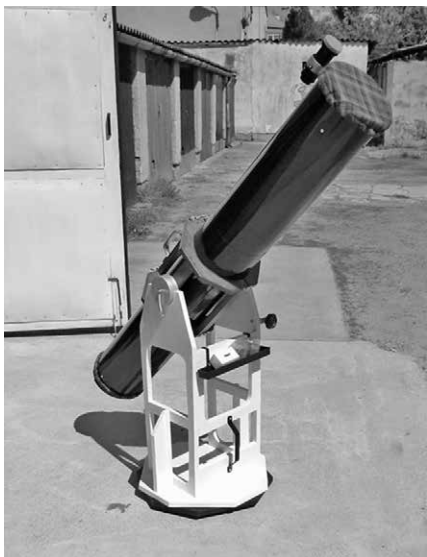
Az elkészült távcső bevetésre készen