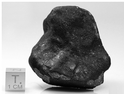
A legnagyobb hazai Sidi Ali Ou Azza példány (96,38 g)

délután egy fényes, hangrobbanással járó, nappali tűzgömböt láttak. Mivel a marokkói sivatag az 1990-es évektől elsődleges meteorit lelőhelynek számít, képzett helyi meteoritvadászok azonnal megkezdték a darabok keresését. A fejetlen úthálózat és a 40 fok feletti hőmérséklet nagyon megnehezítette a keresést, de végül augusztus 2-án megtalálták az első meteoritot. A példányok hamarosan eljutottak Hasnaa Chennaouihoz (II. Hasszán Egyetem, Casablanca), illetve további külföldi intézetekbe, köztük Budapestre is. Az MTA Asztrofizikai és Geokémiai Laboratórium kutatócsoportja Kereszturi Ákos vezetésével mikroszkóp tárgylemezre felragasztott 30 mikrométer vastagságú vékonycsiszolatokat vizsgálhatott meg.