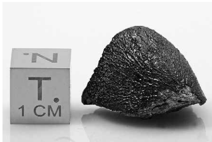
Saját gyűjteményi minta, orientált alakkal, folyási vonalakkal

Az első laboreredmények szerint egy szép fekete, üvegesedett olvadási kérgű, folyásnyomos meteoritról van szó, gyakran repülésorientált, regmaglipes alakokkal. Törött felületük a howarditokhoz hasonlóan világosszürke, regolit breccsás szerkezetű és mivel átmenetet képeznek az eukritek és diogenitek között, ezért mindkét típusból találunk bennük alkotóelemeket, klasztokat. A teljes megtalált tömeg 15,24 kg, a hullás Sariçiçek néven 2016 februárjában lett hivatalos, több hazai gyűjteményben is megtalálhatóak darabjai.