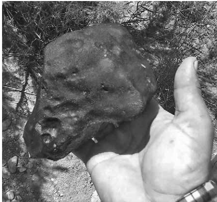
A meteorit 1,554 kg-os fő tömege

Az Isztambuli Egyetem igyekezett minél több meteoritot felkutatni, megvásárolni, de jutott belőlük külföldi intézetekbe, magán-