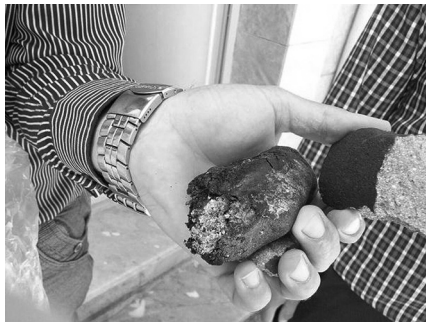
Az összetört és oxidálódott meteoritdarabok

keztető tárgy szakította át házának tetejét. Sejtette, hogy ez a valami az égbolt irányából érkezetett, ezért szétnézett a környéken, és talált is egy másik, a szomszéd ház faláról visszapattant 120 g-os példányt, majd egy 32 g-ost is, amelyik egy nyitott ablakon berepült az egyik szobába. Az összes töredék 630 gramm tömegű. A kisebb darabok eljuttattak a Teheráni Egyetemre, illetve a francia CEREGE-be, azonosítás céljából. Ezek szerint a meteorit egy H/L 3 osztályú kondrit, fekete olvadási kéreggel, világosszürke belső szerkezettel. Összetétele: fémes FeNi, olivin, alacsony kalcium tartalmú orto-piroxén, némely kondrumot troilitgyűrű vesz körül. A meteorit felülete erősen oxidált, valószínűleg sok időt töltötte a nedvesebb, párás nyári iráni levegőn. A legnagyobb darabot megpróbálta megvásárolni a híres francia meteoritvadász és szakértő, a párizsi Luc Labenne. A tulajdonos rá is állt az üzletre, de pár hónap múlva mégis visszalépett, valószínűleg végül itt is győzött a hazafiasság, a nagyobb darabok végül Iránban maradtak. A meteorit november 24-én lett hivatalos Famenin H/L 3 néven, a H/L osztályozás azt jelenti, hogy a meteorit egyes részein H, míg más részein L kondrit jellemzők mérhetők.