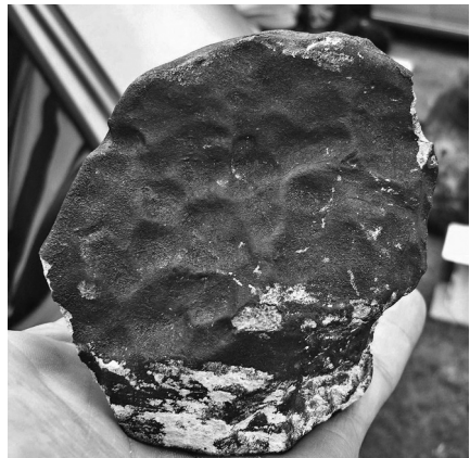
A San Carlos meteorit 712 g-os fő tömege

A házban élő család elmondása szerint szeptember 18-án este csak a lányuk tartózkodott otthon, aki éjjel 2 óraker lefeküdt aludni. Éjszaka nem észlelt semmi szokatlant, de reggel arra ébredt, hogy egy lyukon fény szűrődik be a tetőn keresztül. Az elképedt szülőkkel együtt megvizsgálták a szobát és a szilánkosra tört tetőt. Végül látták, hogy az ágy és a televíziós készülék is megsérült, majd megtalálták egy kb. zsemle méretű fekete követ és egy kisebb másikat. Gondolták, hogy a tárgy az űrből érkezhetett, amit gyors internetes tájékozódásuk is alátámasztott. Ezután vették fel a kapcsolatot Gonzalo Tancredivel (Uruguayi Köztársasági Egyetem, Csillagászati Tanszék), aki J. M. Monzon meteoritgyűjtővel meglátogatta a családot, és meteoriként azonosította a tárgyat.