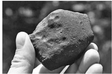
A 450 grammos meteorit és a friss olvadási kéreg

A laboreredmények azt mutatják, hogy az L4 S2 W0 típusú, elsőként megtalált kisebbik darab tankönyvbe illően orientált, fekete elsődleges olvadási kérges meteorit, hátoldalán másodlagos olvadási kéreggel. A robbanásakor megnyílt belső szerkezete világoszürke színű, de már enyhén oxidálódott a páras trópusi klíma miatt. A meteorit 2015. május 24-én vált hivatalossá a Meteoritical Bulletinben Porangaba néven. A meteoritból hazánkba is eljutott csekély mennyiség, bár a brazil tulajdonos csak nagyon kevés minta külföldre viteléhez járult hozzá, mert hazájában szeretné tudni a meteoritot.