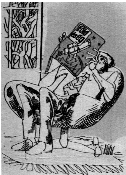
Karikatúra a hetvenes évekből. A Föld és Ég életünk része volt

ket, és sokan ismerkedhettek meg a csillagos égbolttal, az 1 forint 50 fillérbe kerülő csillag-terkép segítségével.