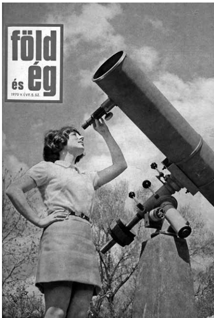
Amatőr építésű távcső az 1970/5. szám címlapján