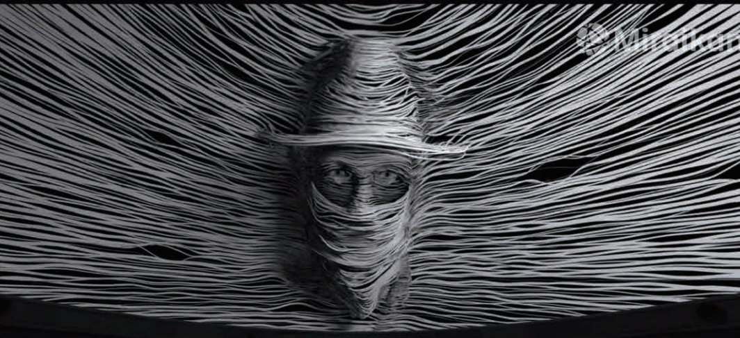
Egy képkocka a The Man from the 9 Dimensions című filmből (bővebben lásd Fulldome Fesztivál című cikkünket)