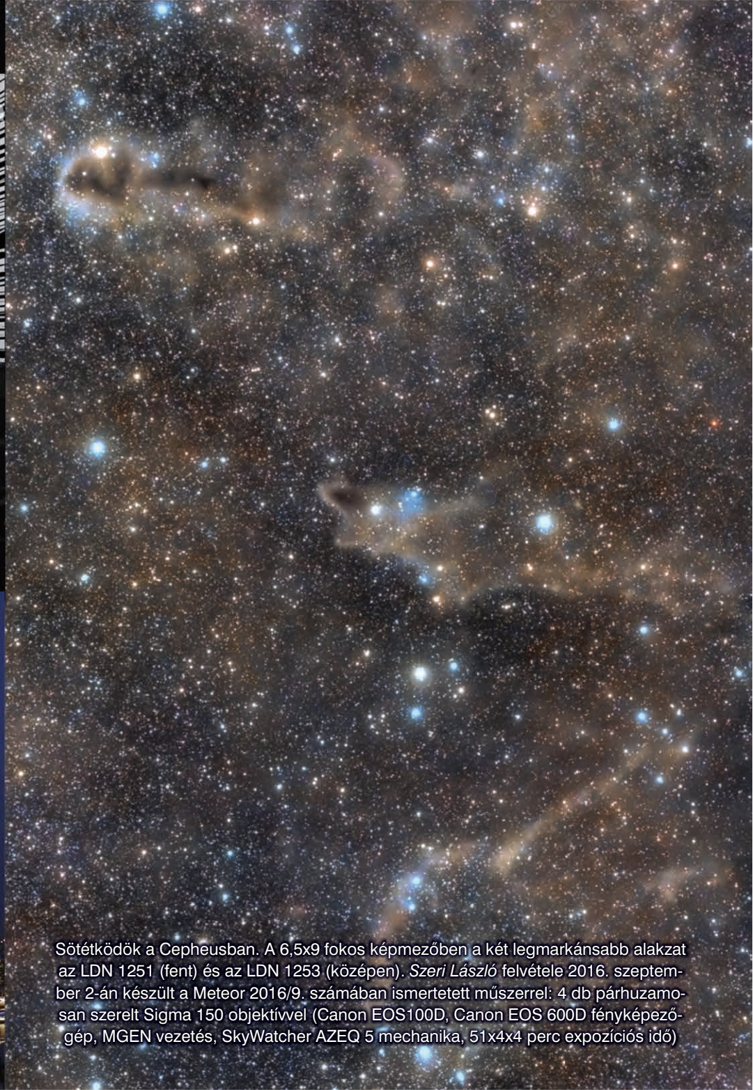
Sötétködök a Cepheusban. A 6,5x9 fokaléptékű képfelvételben a két legmarkánsabb alakzat az LDN 1251 (fent) és az LDN 1253 (középen). Szeri László felvétele 2016. szeptember 2-án készült a Meteor 2016/9. számában ismertetett műszerrel: 4 db párhuzamosan szerelt Sigma 150 objektívvel (Canon EOS100D, Canon EOS 600D fényképezőgép, MGEN vezetés, SkyWatcher AZEQ 5 mechanika, 51x4x4 perc expozíciós idő)