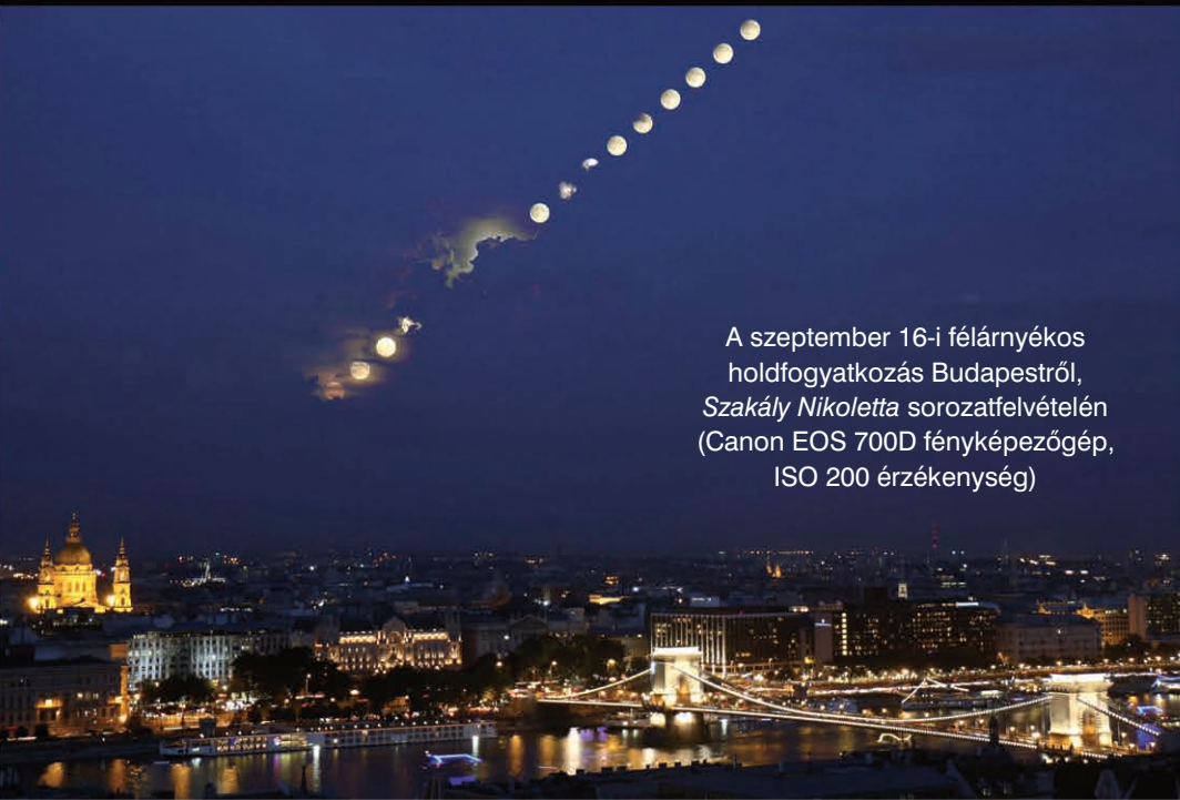
A szeptember 16-i félárnyékos holdfogyatkozás Budapestről, Szakály Nikoletta sorozatfelvételén (Canon EOS 700D fényképezőgép, ISO 200 érzékenység)