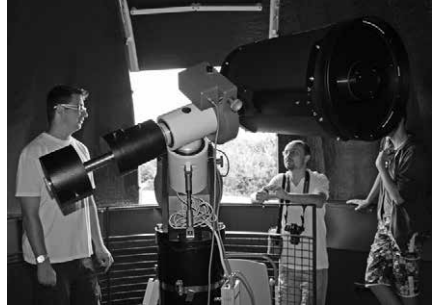
Látogatóban a Zselici Csillagpark kupolájában, a 406/3251-es Schmidt–Cassegrain-távcsőnél