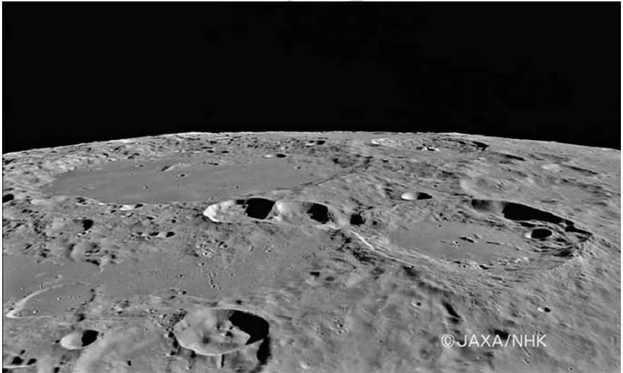
A Von Kármán-kráter a japán Kaguya (Selene) űrszonda felvételén

különbséggel, hogy ez utóbbi, egy magánál valamivel kisebb kráterre települt. Egy biztos, ha a Von Kármán-kráter a Hold innesső oldalán lenne, akkor egyike lehetne a legnépszerűbb holdi célpontoknak. A Von Kármán eredetileg egy központi csúcsos, teraszos falszerkezetű komplex kráter volt, amely a viharos történelmének köszönhetően mára egy feltöltött aljú romkráterre vált. A hatalmas központi csúcs összeér a kráter északi részét elborító világosabb színű törmelékkel. Ez a törmelék az északkeletre lévő, fiatal Finsen-krátertől származik. Ezt leszámítva a Von Kármán-kráter talaja sima, csak néhány kisebb parazitakráter látható a lávával borított felszínén. De ha olyan felvételeket nézünk, amelyek alacsonyabb megvilágítási szög alatt készültek, akkor a talaj délnyugati részén, a sánc és a központi csúcs között egy nagy méretű, de alacsony, dómszerű képződményt is felfedezhetünk. A Chang-e-4 a Kármán-kráter keleti részén, a fentebb már említett törmeléktől kissé délre ért talajt. Noah Petro geológus szerint a leszállóhely pontos koordinátái: déli szélesség: 45,47084^\circ , keleti hosszúság: 177,60563^\circ .