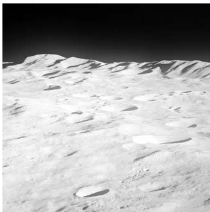
A Déli-sarki Aitken-medence északi gyűrűje az Apollo-8 felvételén (NASA)