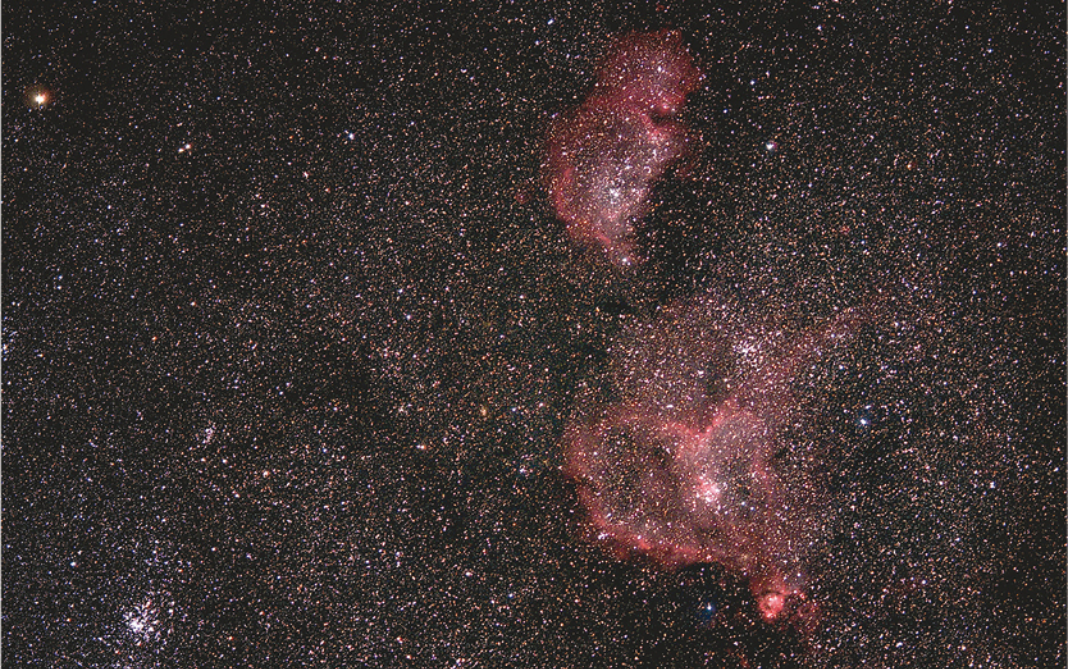
A Szív- és Lélek-köd (IC 1805, IC 1848), valamint a Perseus-ikerhalmaz (Sigma 105 mm-es teleobjektív, Canon 1100D, 35x60 s, ISO 800-on, Homoródfürdő, Romania)