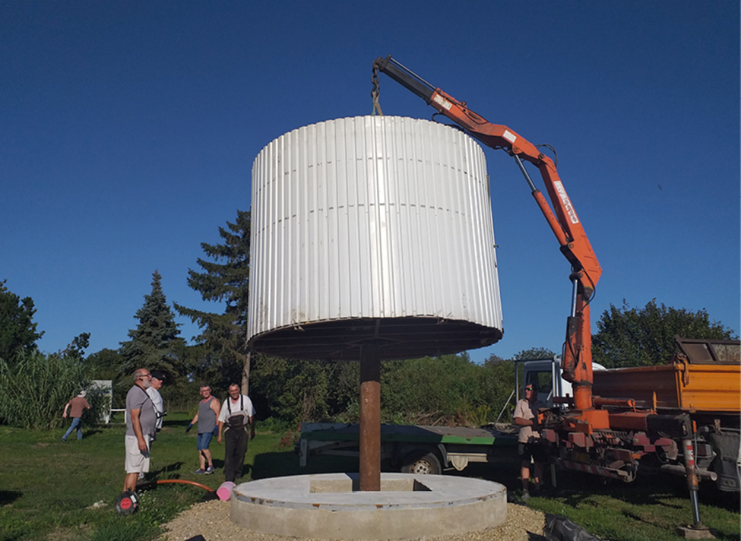
Az MCSE Csillagtanya kupolájának beemelése szeptember 9-én