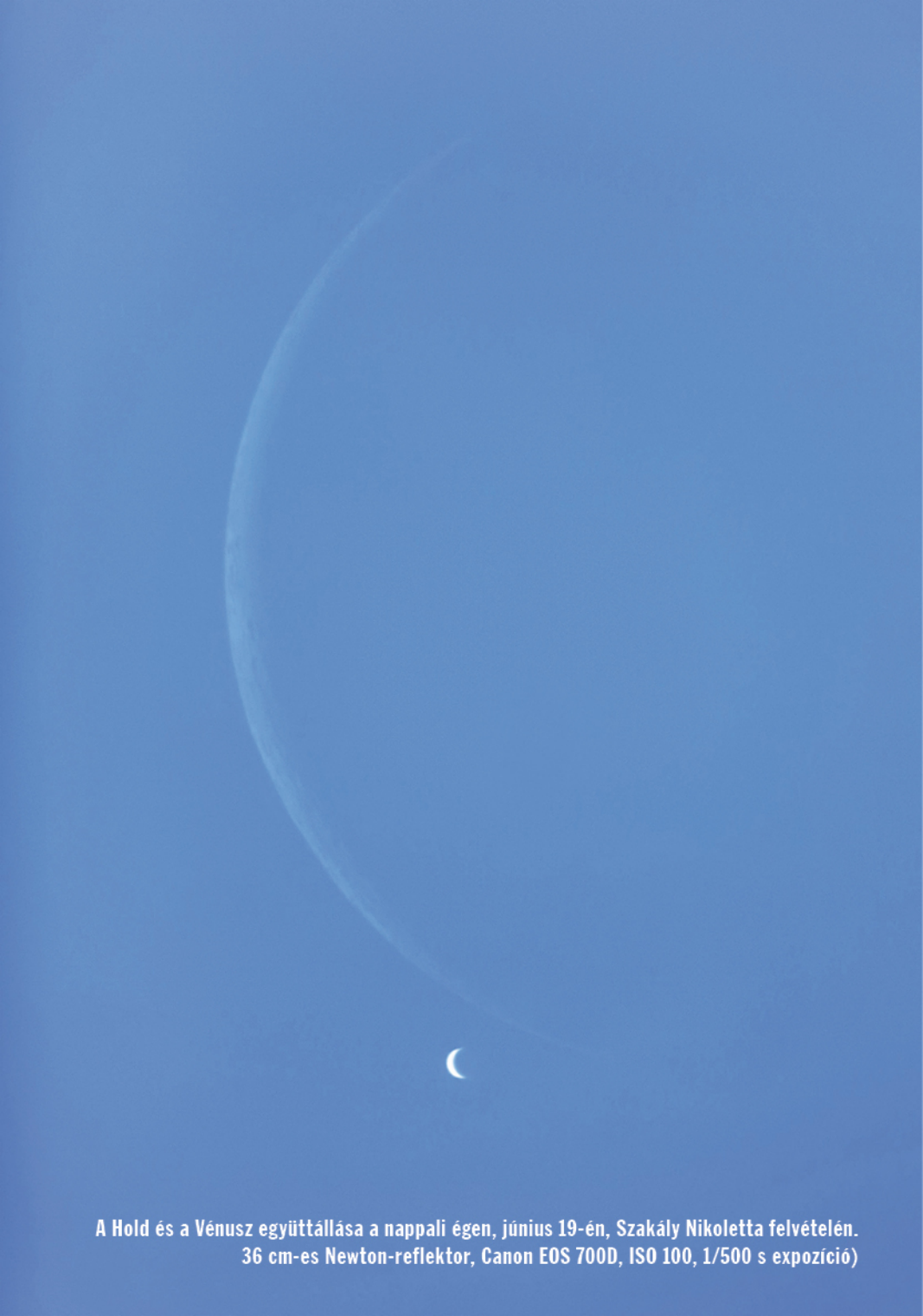
A Hold és a Vénusz együttállása a nappali égen, június 19-én, Szakály Nikoletta felvételén. 36 cm-es Newton-reflektor, Canon EOS 700D, ISO 100, 1/500 s expozíció)