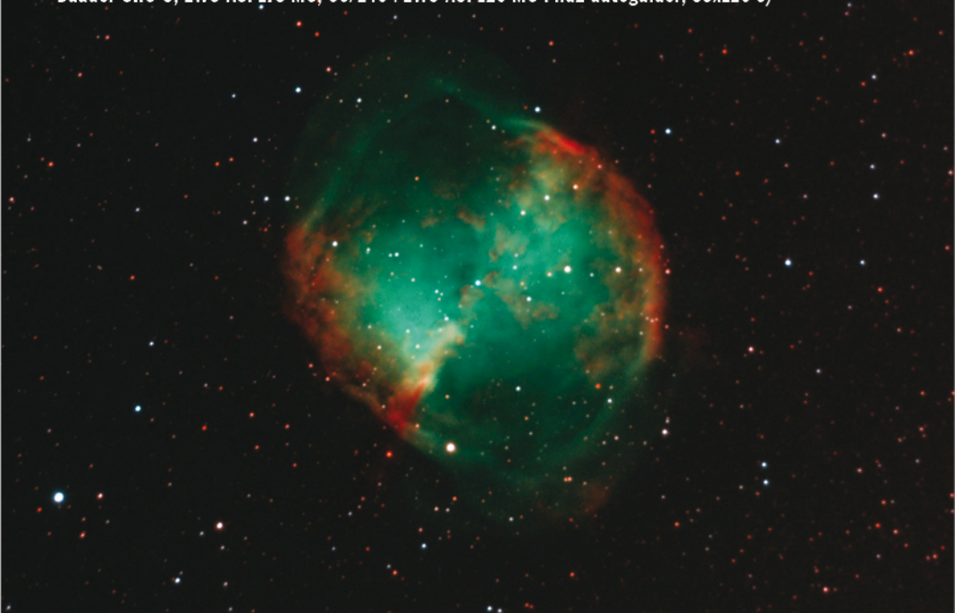
Szabó Szabolcs Zsolt rendkívül részletes felvétele az M27-ről (Fornax 102, MC3, 254/1200 Newton, Baader UHC-S, ZWO ASI 178 MC, 60/240+ZWO ASI 120 MC Phd2 autoguider, 55x120 s)