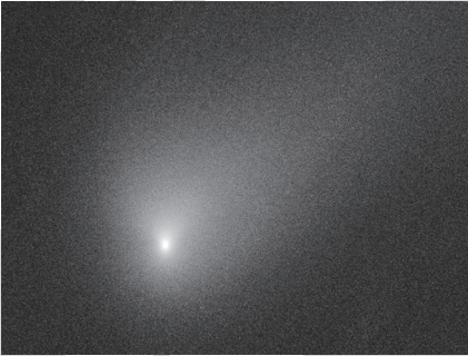
A 2I/Borisov csillagközi üstökös. Pont úgy néz ki, mint egy üstökös.

Miért különbözött ennyire az 'Oumuamua és a Borisov? Ki tudja. Talán tényleg ennyire eltérő égitestek voltak: de a Naprendszer saját üstökösei és kisbolygói között is találni egészen különleges példányokat. Vagy talán csak túl keveset sikerült megtudnunk az akkori megfigyelésekből, hogy pontos képet kapjunk róluk.