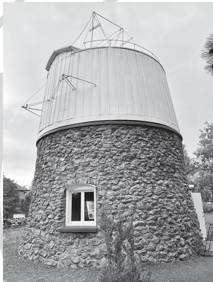
A Lowell Obszervatórium híres Pluto kupolája, amelyben a 33 cm-es asztrográf „lakik”

látogatásra. A 60 cm-es Clark-refraktor, amivel Lowell a Mars csatornáit próbálta megfigyelni; Clyde Tombaugh irodája és lakószobája; a méretarányos naprendszer-modell, ami a Pluto-felfedező asztrográf kupolájáig vezet; a szépen restaurált és/vagy mindmáig újszerű állapotban megőrzött historikus műszerek – ha vannak a csillagászatban kiemelt történelmi kegyhelyek, akkor a Lowell mindenképpen közöttük van. Ami