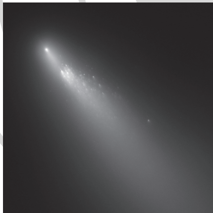
A Tau Herculidák meteorraj szülőégítete, a 73P/Schwassmann–Wachmann-üstökös magjának darabolódása (B komponens). A Hubble-űrtávcső felvétele 2006. április 18-án készült