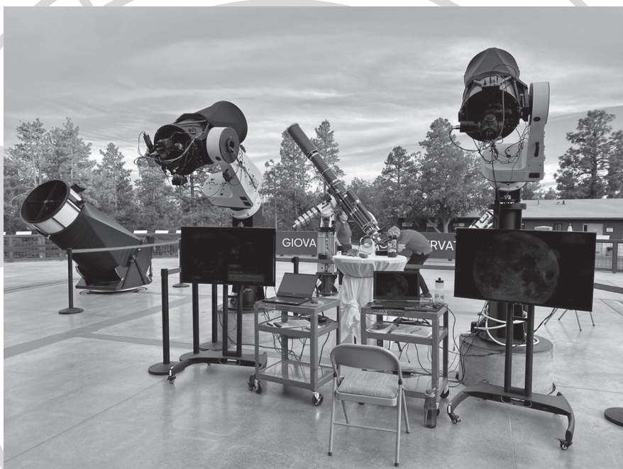
A Lowell Obszervatórium látogatóközpontjának észlelőterasa. A fémsíneken gördülő épület alatt a legnagyobb távcső egy 80 cm-es Dobson-teleszkóp (bal szélén), a kevésbé fényigényes objektumokhoz kisebb Schmidt-Cassegrain- és lencsés távcsövek használhatók

A csillagászat oldaláról pedig megállapíthatjuk, hogy a meteorocsillagászati előrejelzések egyre pontosabbak, egészen egzotikus kitérőket, nagyobb porfelhőkkel való találkozások által kiváltott rajerősödéseket sikerül már kiszámítani. Az időbeli lefutás előrejelzési pontossága azonban felülmúlja az aktivitás erősségére vonatkozó becslések