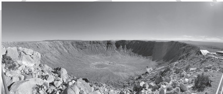
Az 1,2 km átmérőjű Barringer-kráter Arizonában. Kora nagyjából 50 ezer év, és egy hozzávetőlegesen 50 méter átmérőjű kisbolygó becsapódása hozta létre

Egy külön cikket lehetne írni csak ebből az öt naphból, így most inkább Flagstaff környékéről szemezgetünk. Az arizonai hegyvidéken található város nagyon más volt a többitől, amit láttunk a 12 napos amerikai út alatt. A hegyvidéki klíma része a telente lehulló 2–2,5 méter hó, nyáron pedig hiába van napközben 30–35 fok, hajnalra lehül 4–6 fokra a hőmérséklet. Ezt jól tükrözik a masszívabb építésű, néhol