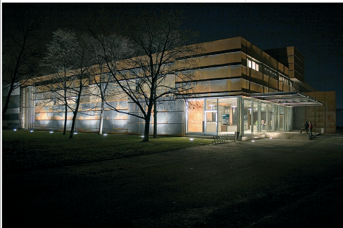
Kiss és Járomi Építésziroda Paksi Képtár

A megvalósult terv nemcsak hogy kítűnően megfelel az intézmény napi működése által igényelt gyakorlati feladatoknak és elvárásoknak, hanem egy új landmarkkal is gazdagítja Paks városképét.