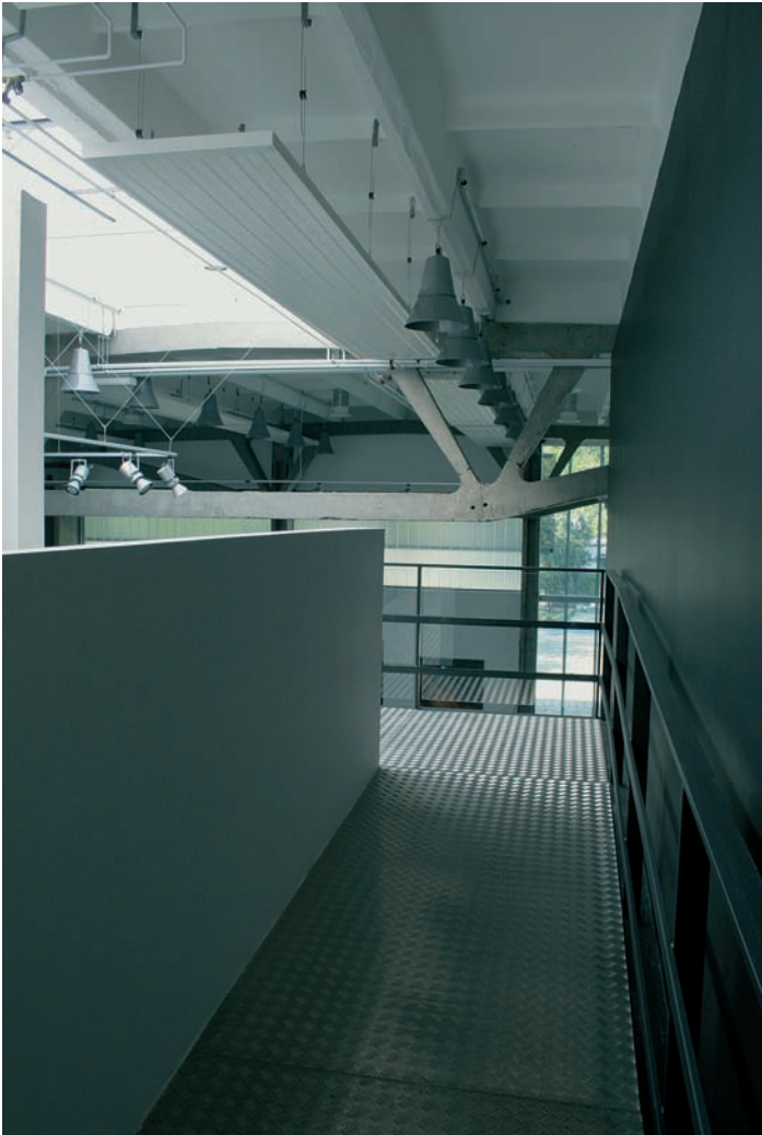
Kiss és Járomi Építésziroda Paksi Képtár

2005 végén meghívásos tervpályázatot írt ki a Paks Város Önkormányzata, melyet a KISS ÉS JÁROMI ÉPÍTÉSZIRODA nyert meg. Közben elkészült a projekt leírás (szakmai programterv-konceptió, működési és fenntarthatósági számítások, -tanulmányok, helyzetelemzés stb.). A OKM által kiírt Alfa Program, azaz a helyi önkormányzatok által fenntartott múzeumok szakmai támogatása keretében sikeres pályázaton az Önkormányzat-Paksi Képtár 95.5 millió forintot nyert.