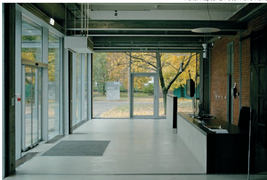
Kiss és Járomi Építésziroda Paksi Képtár

A Paksi Képtár 1991-es létrehozásától napjainkig ideiglenes elhelyezéssel működött. Az alapító HALÁSZ KÁROLY. A gyűjteménynek helyet adó, volt Erzsébet Szálló épületét az Önkormányzat 2005-ben értékesítette, amivel párhuzamosan megindult a Képtár új helyének előkészítése. Az Önkormányzat megvásárolta a város déli részén található, rohamosan fejlődő területén egy összességében 1100 m 2 alapterületű, használaton kívüli üzemcsarnokot, valamint a hozzátartozó 1026 m 2 -es telekrészt, melynek átalakításával és felújításával kívánja a Képtár működéséhez szükséges feltételeket biztosítani. Az üzemcsarnok része a valamikori Konzervgyár épületegyüttesének, melynek terhei és előnyei együttesen szabták meg a felmerülő elképzelések lehetséges irányait. Mindenesre megkönnyítette a helyzetet az, hogy az ipari területek jellemzője a viszonylag egyenletes területi eloszlás és emiatt a térszerkezetek kialakítása arányos.