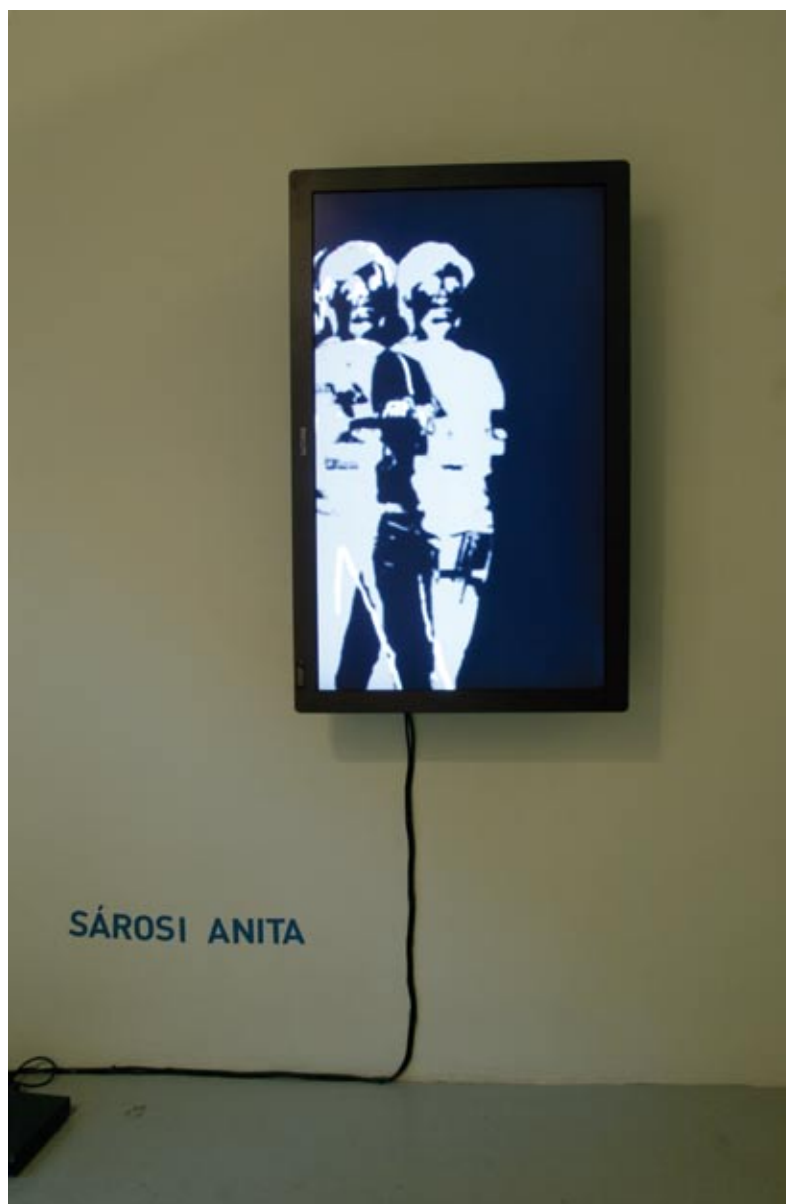
Sárosi Anita ASA, 2008