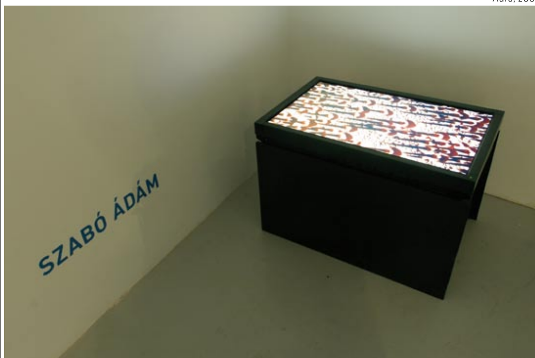
Szabó Ádám Aura, 2003