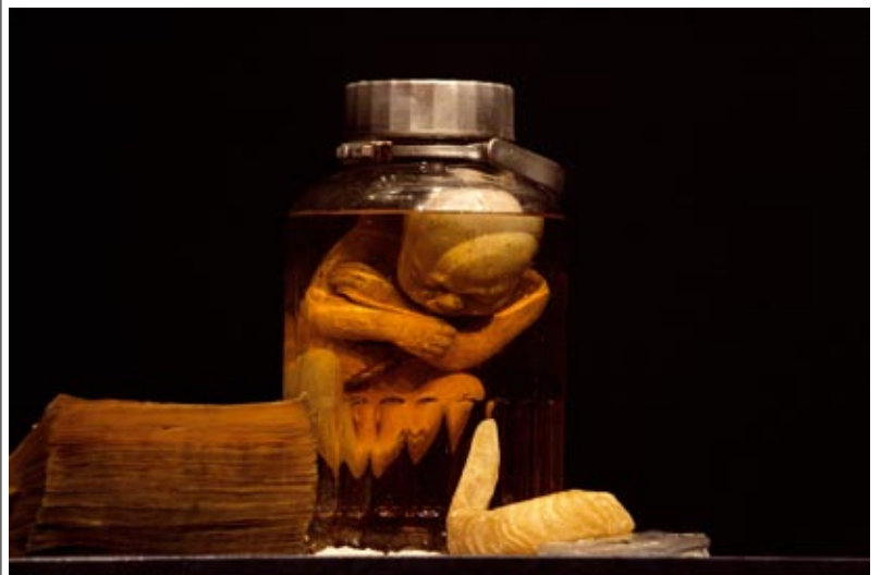
Ágens és a Természetes Vészek Kollektíva IPSUM – önmagadat – Codex VI: A mennydörgés, tökéletes elme, fotó: Mátyás Attila