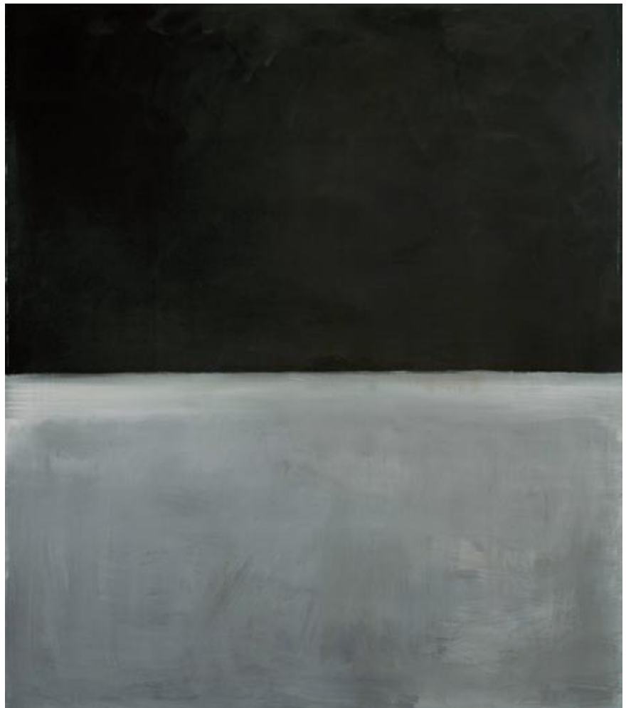
Mark Rothko Cím nélkül, 1969 akril, vászon, 233,7 × 200,3 cm Collection Christopher Rothko © 1998 Kate Rothko Prizel & Christopher Rothko / VG Bild- Kunst, Bonn 2008

védjeggyé vált Multiform-festmények döbbenetes tér- és színkezelésével hozhatók összefüggésbe – rá lehet mutatni, de a már csak számokkal jelzett 1949 utáni festmények szín- és fényáteresztő felületeinek elemzése szempontjából mindez értelmetlen és megtévesztő.