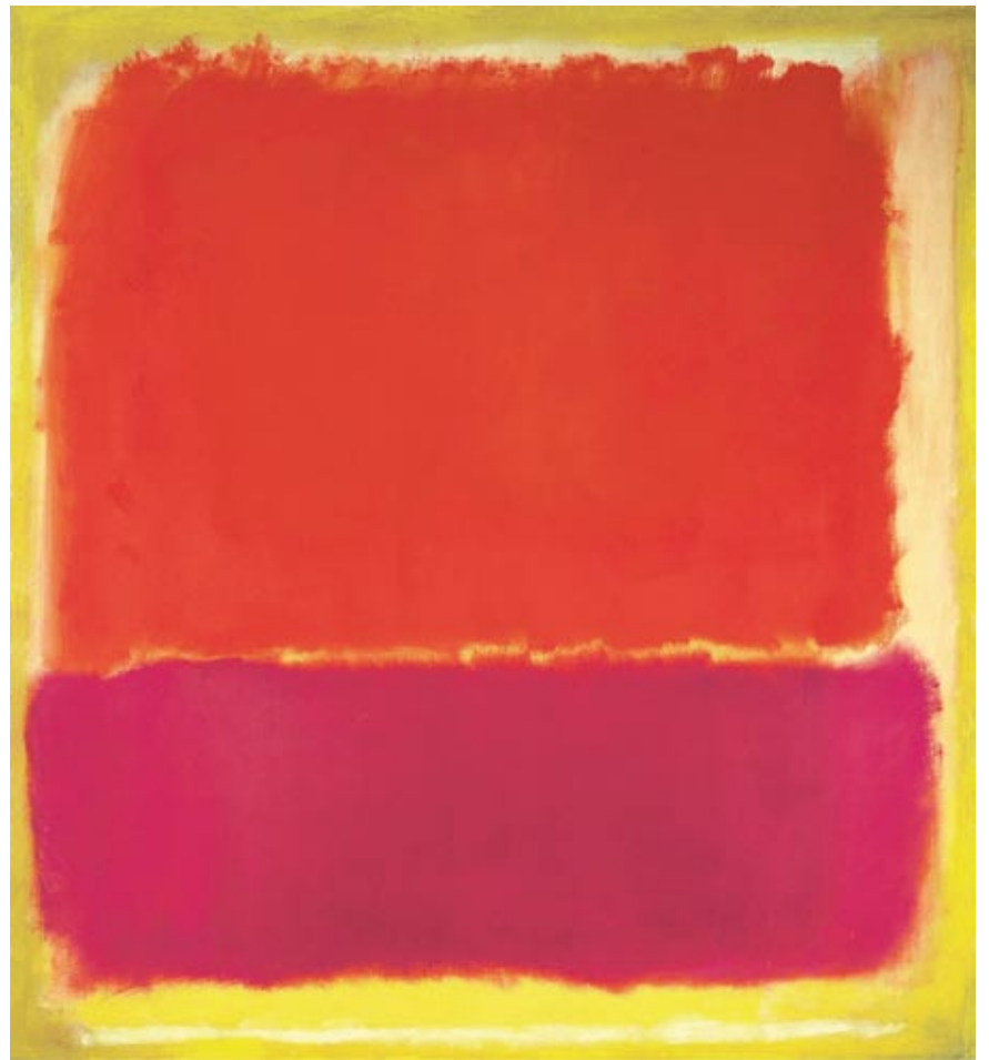
Mark Rothko No. 12, 1951, vegyes technika, vászon, 145,4 × 134 cm, magángyűjtemény

A nézővel való feszített dialógus kezdett egyre intimebbé válni: az Art News című folyóirat egy fotósorozatot indít, melyben a művész akció közben, saját műtermében hozza „testközelbe” a nézővel. Elaine de Kooningnak sikerült mindezt még Rothkóra is kiterjesztenie, pedig