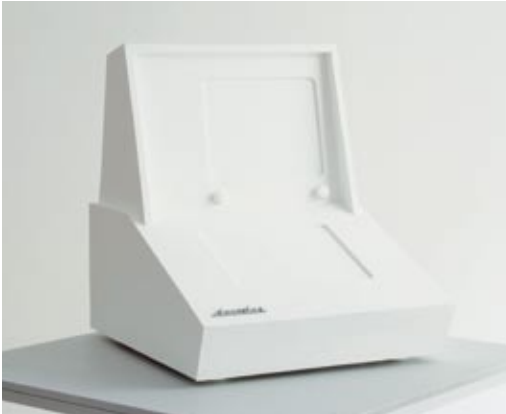
Albert Ádám decoder III., 2008, installáció, MDF, vas, fa, 43 × 43 × 33 cm