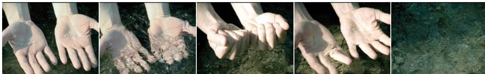
Vincze Ottó Bóvíz, tiszta, 2008 ■ fotók: Csató Máté