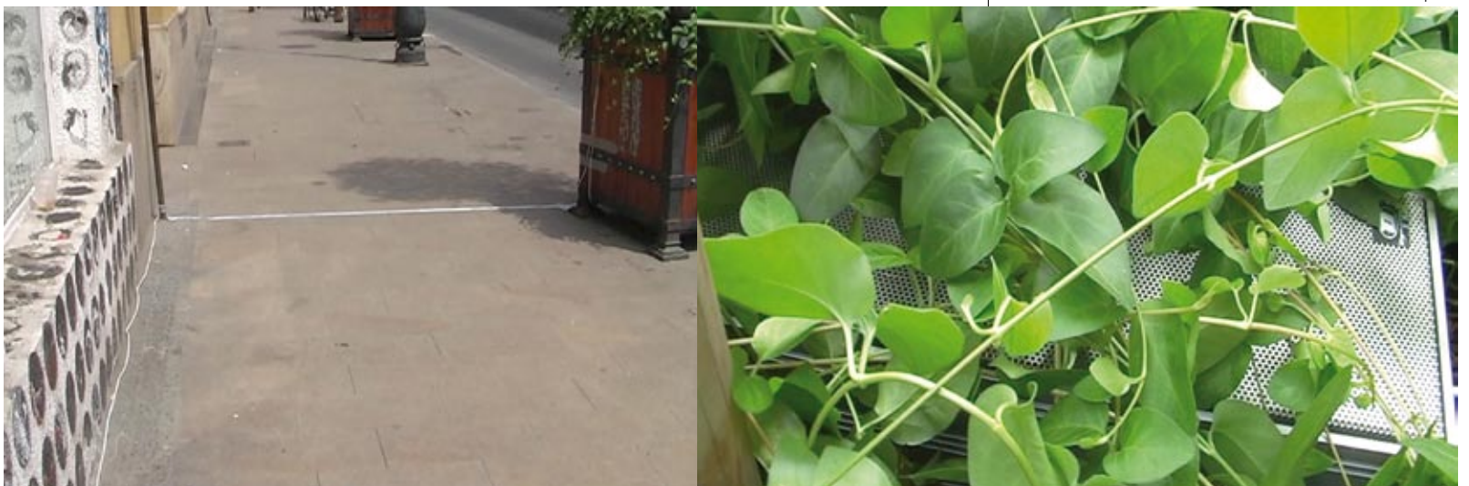
Kim Cascone Field Diffusion, 2008, Budapest

☕ Ennek többféle indoka volt... Elkezdttem mainstream filmekkel dolgozni Hollywoodban, de egyre brutálisabbá váltak a munka körülmények. A befektetett órák, amelyeket eltöltöttem egy film kapcsán, egyáltalán nem álltak arányban sem a végeredménnyel, sem azzal, amit én profitáltam mindebből. Végig intenzív hatás alatt állsz: más emberek, a rendező és a stáb hatása alatt. Én viszont a saját ötleteimet, a saját munkámat szerettem volna folytatni, szabadon akartam kísérletezni a dolgokkal. Így azután otthagytam a nagy filmeket, és független filmekben dolgoztam, múlt évben például a Cosmonaut Polyakov (r: Dana Ranga), amely egy