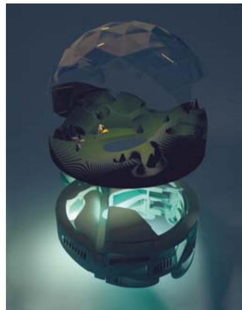
2048 Faller world model; p. 129, 131