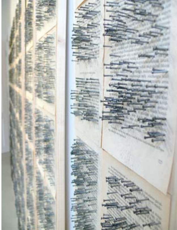
RÁCZ MÁRTA e8752, (részlet), 2007, installáció; (Stúdió Galéria)

totta annak a lehetőségétől, hogy szellemi társ legyen, amit magunkkal hordunk.