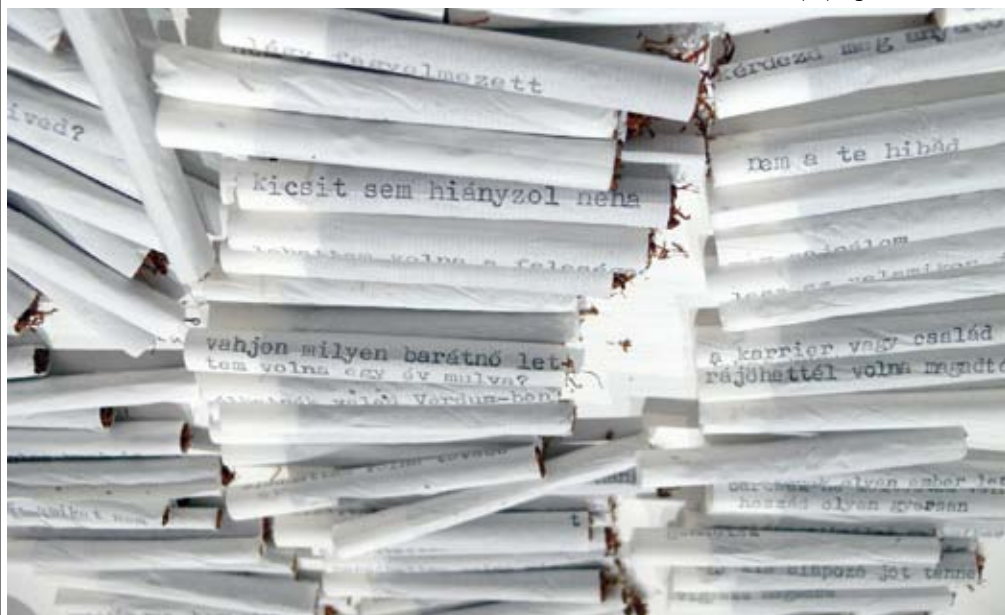
RÁCZ MÁRTA Szimfónia, 2008, installáció; (Gallery By Night, Stúdió Galéria)