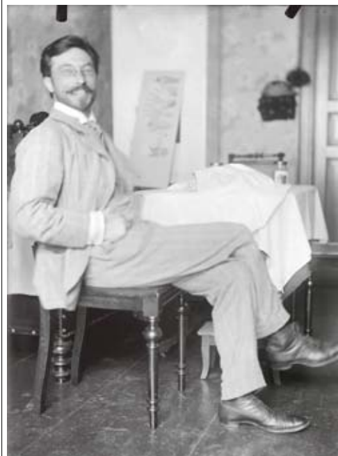
Vaszilij Kandinszkij 1905 nyarán Drezda, Schnorrstraße 44.

s ne egy ismeretlen kézről elveszített kesztyűhöz hasonlítson”, mindenképpen szíven találják az olvasót, még akkor is, ha néhány állítása ma már inkább csak a művészettörténet számára mond valamit. 1