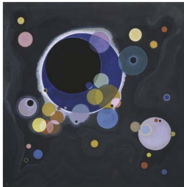
VASZILIJ KANDINSZKIJ Egyes körök, 1926, olaj, vászon, 140,3 × 140,7 cm The Solomon R. Guggenheim Museum, New York © VG Bild-Kunst, Bonn

lyik európai városban (1993 Verona, 1994 Berlin, 1995 Strassburg, 2001 Milánó, 2003 Madrid és Bécs, 2004 Wuppertal, 2006 London), amelyek hol egyik, hol másik alkotói periódusát helyezték a középpontba, így nem csoda, hogy az absztrakt művészet „feltalálója”, az egyik legismertebb művészé vált az óceán mindkét oldalán.