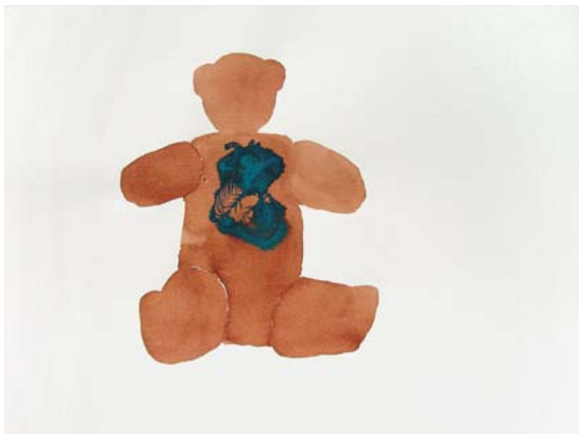
CHILF MÁRIA Brumival bármi megtörténhet; berendezkedni a hiányra, 2005