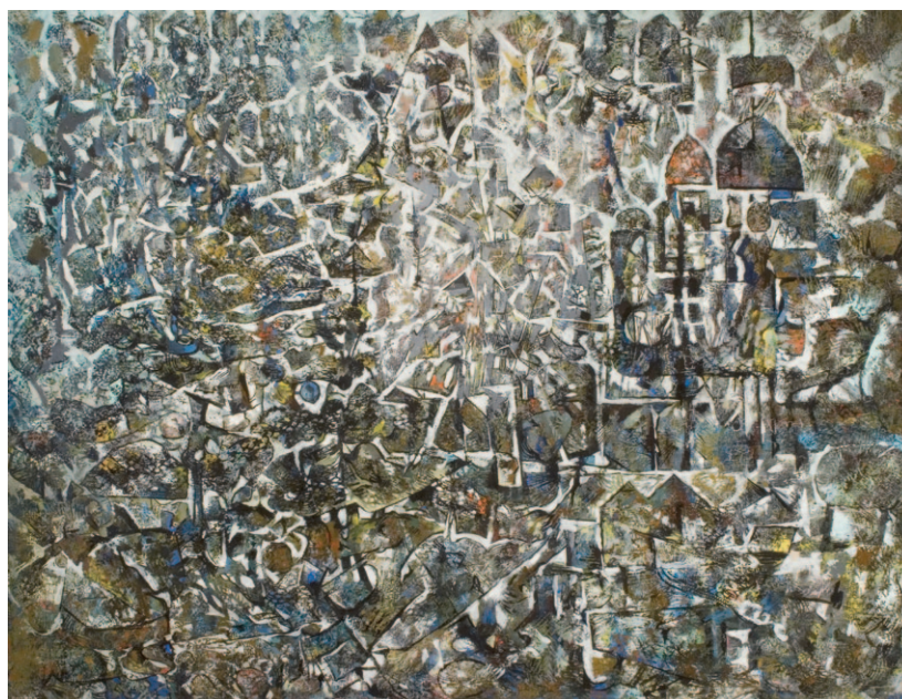
ROZSDA ENDRE XIV. Lajos Bizáncban, 1963, olaj, vászon, 90 x 116 cm, magángyűjtemény, Párizs