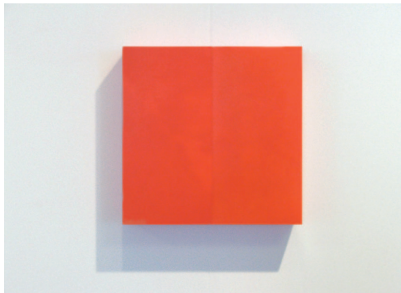
SHAWN WALLIS Fatime keze II., 2000, olaj, fa, vászon gipsz-alap, 46 × 46 × 10 cm kölcsonözve: Galerie Lindner, Wien