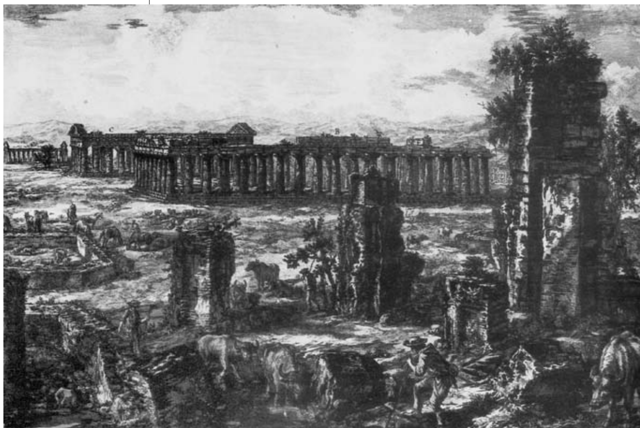
GIOVANNI BATTISTA PIRANESI Paestum, 1778