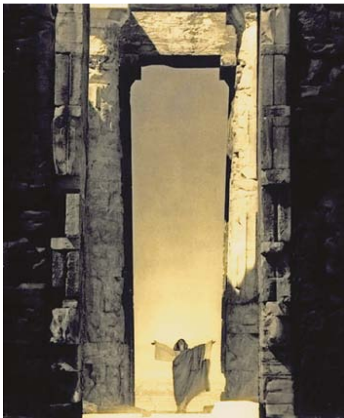
EDWARD J. STEICHEN Isadora Duncan a Parthenón portálján, 1921