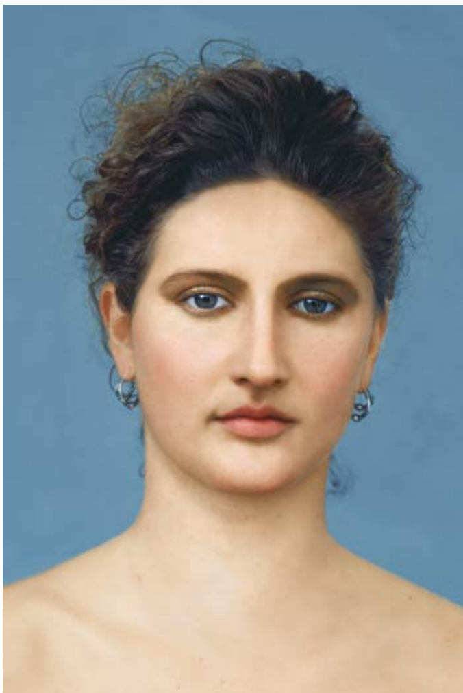
LAWICKMÜLLER perfectlySUPERnatural AthenaSimone, 1998–2002 digitális print

benne rejlő lehetőséget. A Velletri sorozat fotói jól példázzák, hogy többnyire a valóságos emberektől való averzió vezet az antik plasztika csodálatához. 11