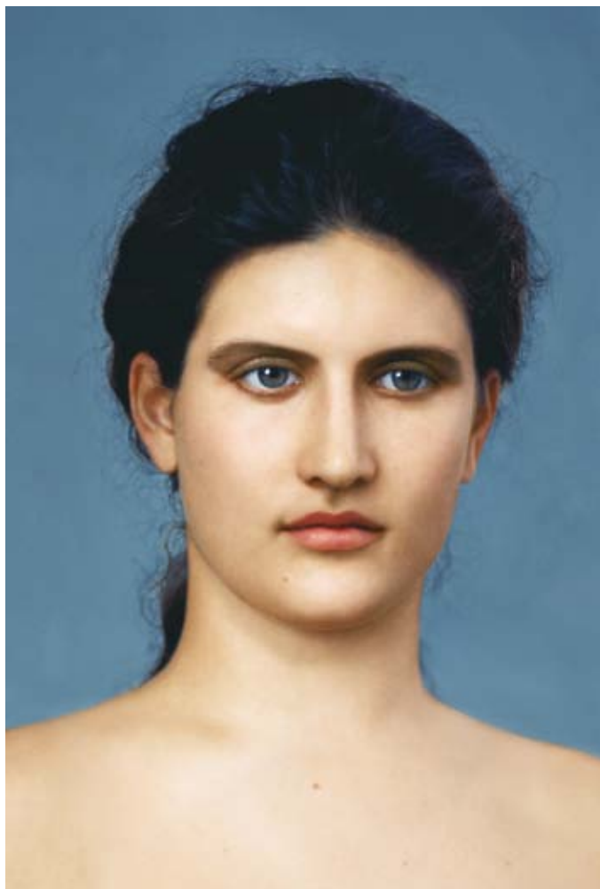
LAWICKMÜLLER perfectlySUPERnatural AthenaNina, 1998–2002 digitális print