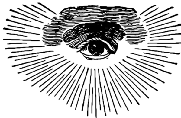
A mindent látó szem egy korai szabadkőműves ábrázolása, felhővel és félkörös glóriával

juk a titkos társaság jelképei között. Sokan gondolják úgy, hogy az Egyesült Államok 1782-ben elfogadott Nagypecséjtének hátoldalára szabadkőműves sugallatra 8 került a csonka piramis felett lebegő Mindent látó szem. A pecséten két latin nyelvű mottó olvasható: Annuit Cœptis (Ő – nyilvánvalóan Isten – jóváhagyta vállalkozásunkat) és Novus Ordo Seclorum (A korok új rendje). Ez a design rákerült a mindmáig használatban lévő egydolláros amerikai bankjegyre is. A Mindent látó szem, a kémek ősi szimbólumának szabadkőműves