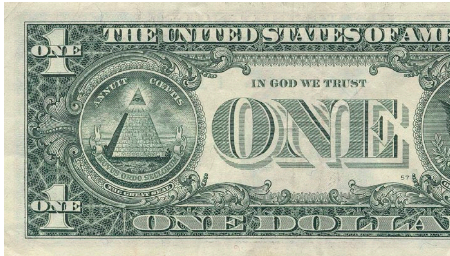
A Mindent látó szem az amerikai egydolláros bankjegy hátoldalán