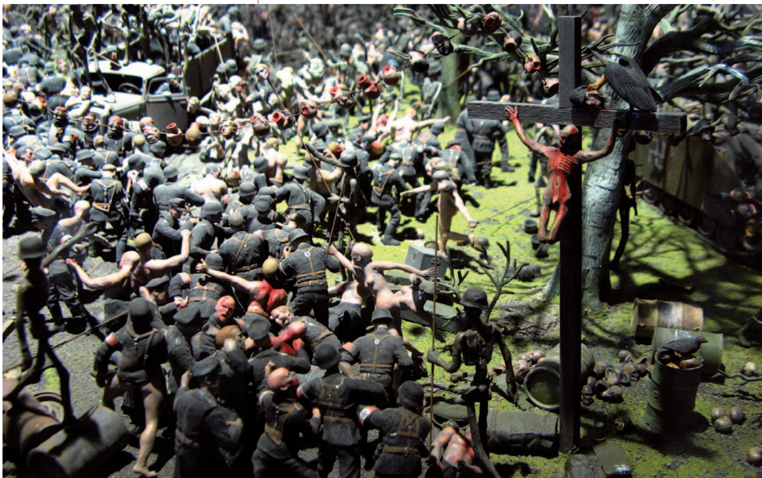
JAKE & DINOS CHAPMAN Fucking Hell (részlet), 2008, üvegyapot, műanyag és vegyestechnika