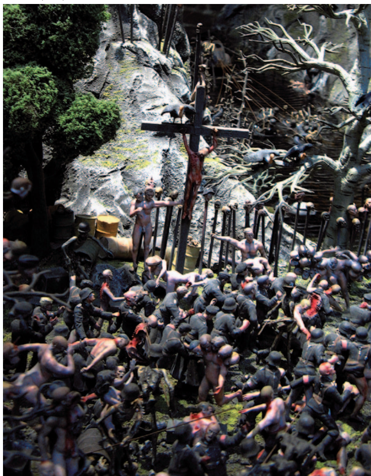
JAKE & DINOS CHAPMAN Fucking Hell (részletek), 2008, üvegyapot, műanyag és vegyestechnika

mékeny táptalaja a félreértelmezéseknek, így például a németalföldi előképek analógiájának: Hieronymus Bosch infernójának keresztény tanítókat kódoló, titokzatos szimbólumrendszerével szemben a Chapman manu-faktúra végtelenségig eltúlzott delíriumában mindenféle morális üzenet megfullad a részletek súlya alatt. A fájdalom eme univerzuma nem vesz