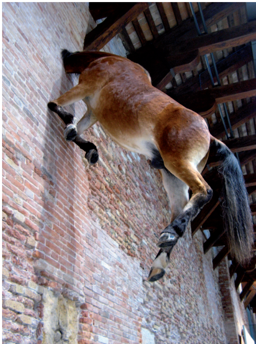
MAURIZIO CATTELAN Untitled , 2007, kitömött ló: lóbbőr, üveggyapot, gyanta, 300 × 170 × 80 cm; © fotó: Györfly László