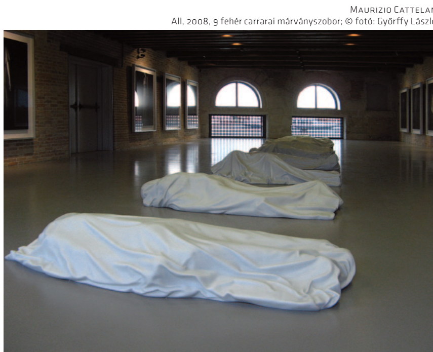
MAURIZIO CATTELAN All , 2008, 9 fehér carrarai márványszobor; © fotó: Györfly László