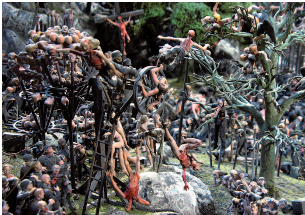
JAKE & DINOS CHAPMAN Fucking Hell (részlet), 2008, üvegyapot, műanyag és vegyestechnika

mékeny táptalaja a félreértelmezéseknek, így például a németalföldi előképek analógiájának: Hieronymus Bosch infernójának keresztény tanítókat kódoló, titokzatos szimbólumrendszerével szemben a Chapman manu-faktúra végtelenségig eltúlzott delíriumában mindenféle morális üzenet megfullad a részletek súlya alatt. A fájdalom eme univerzuma nem vesz