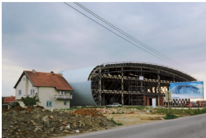
Szabályozás nélkül – Pristina és Szkopje között

és ATU, a belgrádi BAZA és B92, az újvidéki KUDA és ÚJ21, a zágrábi ANALOG és PLATFORMA 9,81 valamint a ljubljanai INSTITUTE FOR POLITICS OF SPACE kiállított projekt-dokumentációiból kirajzolódik az egész Balkán építészettel és urbanisztikával foglalkozó civil szervezeteinek térképe, akik közül sokan a 2006-os Lost Highway projekt során találtak egymásra a hosszú elszigeteltség után; ez a projekt a Balkanology előzményének is tekinthető.