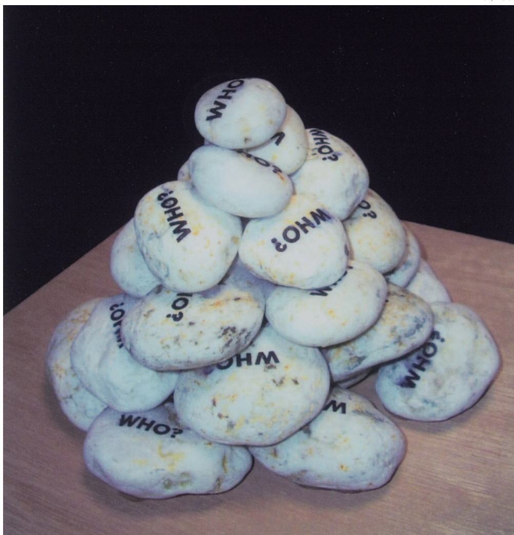
IKUO MORI Who? , 2006