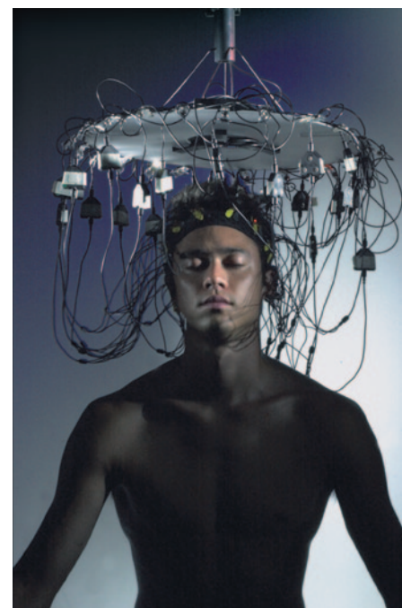
Az agyi elektromosság mérése és feltérképezése