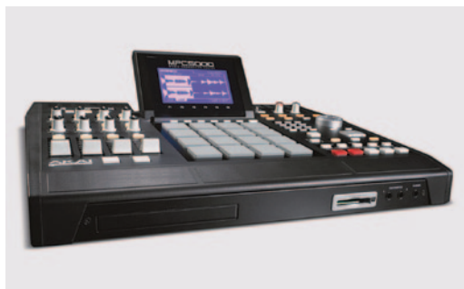
AKAI MPC 5000, a szamplerék királya