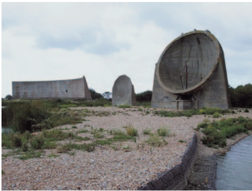
Hangtűkör rendszer, Dungeness