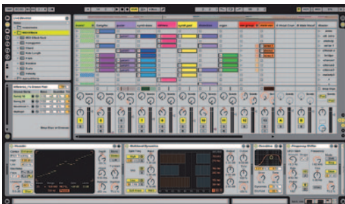
Az Ableton Live kezelő felülete

lyán haladva a sebesség és a szalagkorlát pontosan rögzített határok közé szorítja haladásunkat. Bármilyen hiba végzetes lehet számunkra. A digitális világban minden kiszámítható és tökéletes. A megfelelő felbontással rögzített hangok majdnem olyanok, mint ahogy elhangzottak. Ez a világ csak a lehető világok legjobbika lehet. De valljuk be, meglehetősen unalmas, hiszen hiányzik a szabadság minimális algoritmusai.