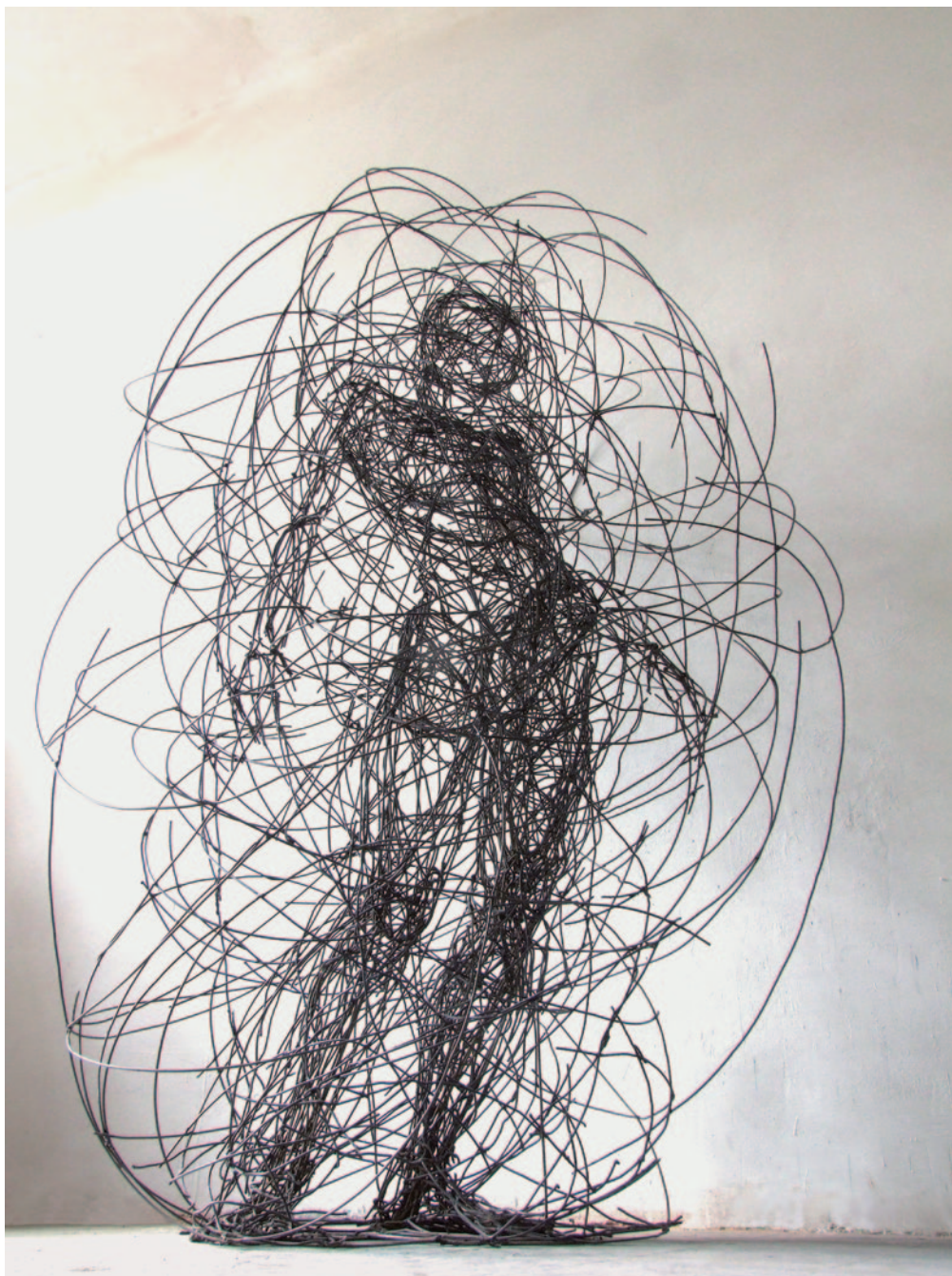
RABÓCZY JUDIT Szerelmes (Kint-bent), 2010, hegesztett vas, 190 × 150 × 150 cm

tás, amelytől függően Rabóczy drótszobrai új és új arcukat mutatják: a drótváz átláthatósága és rajzos vetett árnyéka e művek fontos eleme. A művész anyagválasztása puritán, az egyszerű dróttal azonban bármire képes: egyként hoz létre lírai vagy monumentális figurákat, érzékel-tet teret vagy könnyed mozgást.