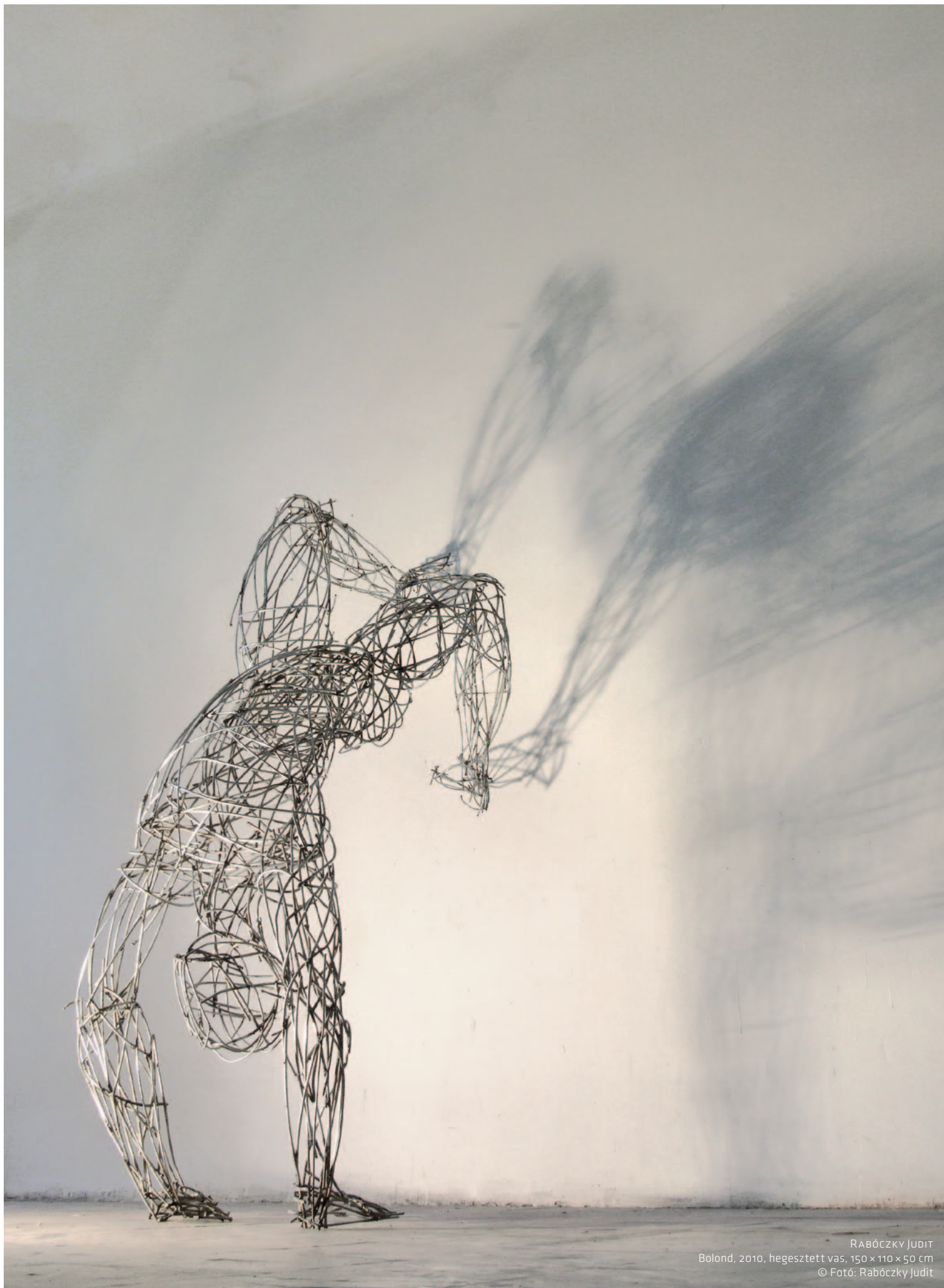
RABÓCZKY JUDIT Bolond, 2010, hegesztett vas, 150 x 110 x 50 cm