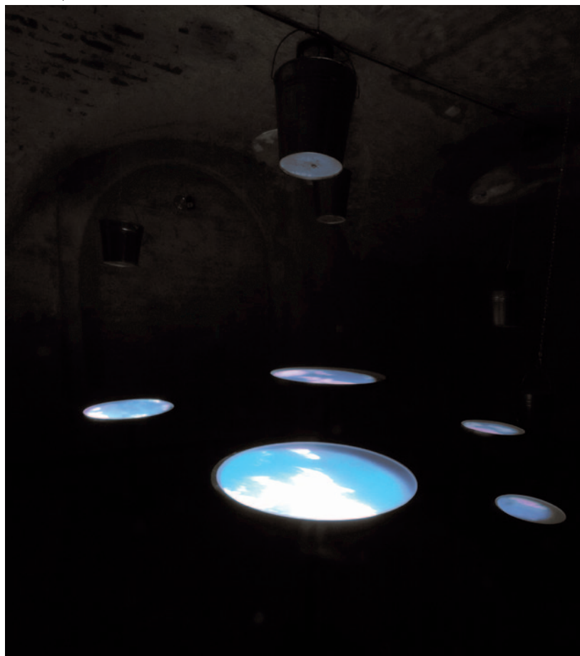
NAGY RÓBERT Szabadnapos Ariadné, részlet a kiállításról, 2010